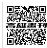
高雄畫刊電子期刊