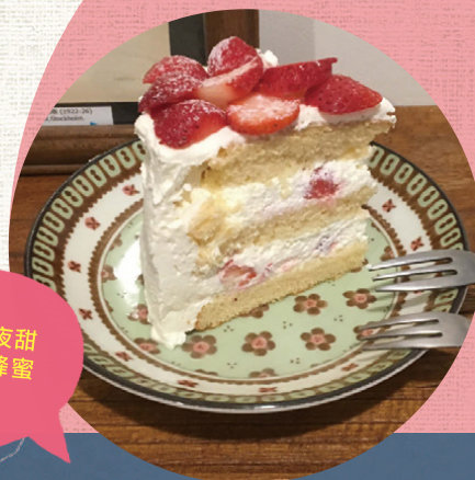
奶油仙子的深夜甜點劇場「草莓蜂蜜鮮奶油蛋糕」。