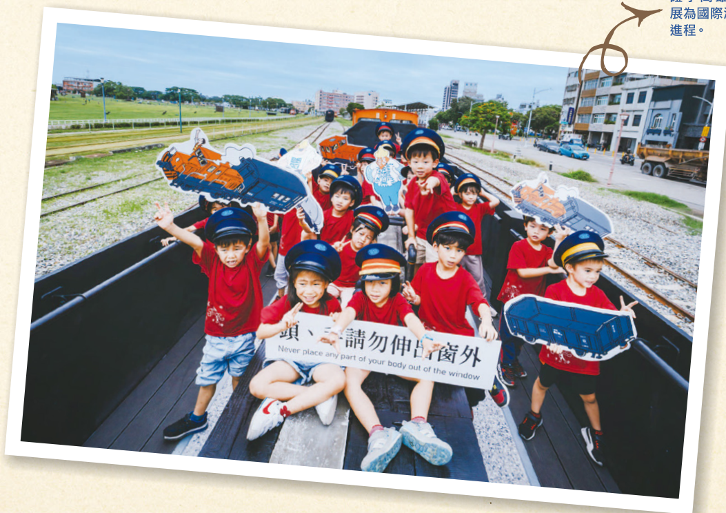
百年濱線與臨港線串連起的鐵道風景，見證了高雄從漁村發展為國際港口的歷史進程。

觀光列車復駛，不僅讓高雄人重溫童年記憶，也讓這條曾經見證高雄港發展的鐵道，重獲生機。無論是老高雄人還是新朋友，都可以在這裡一起重返珍貴的鐵道時光。