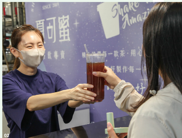
01 蔬果攤位上的蔬菜水果直接陳列，並鼓勵顧客自備袋子購買。02 市場中的手搖飲攤位響應減塑風潮，飲料裝入顧客自備的環保杯中。03 設置在龍華市場外的二手袋循環箱，方便民眾隨手取用，減少忘帶袋子時的尷尬。

市場外設置的二手袋循環箱也是活動的一大特色。許多忘記帶購物袋的民眾，可以在這裡免費取用重複使用的紙袋，做到物盡其用。