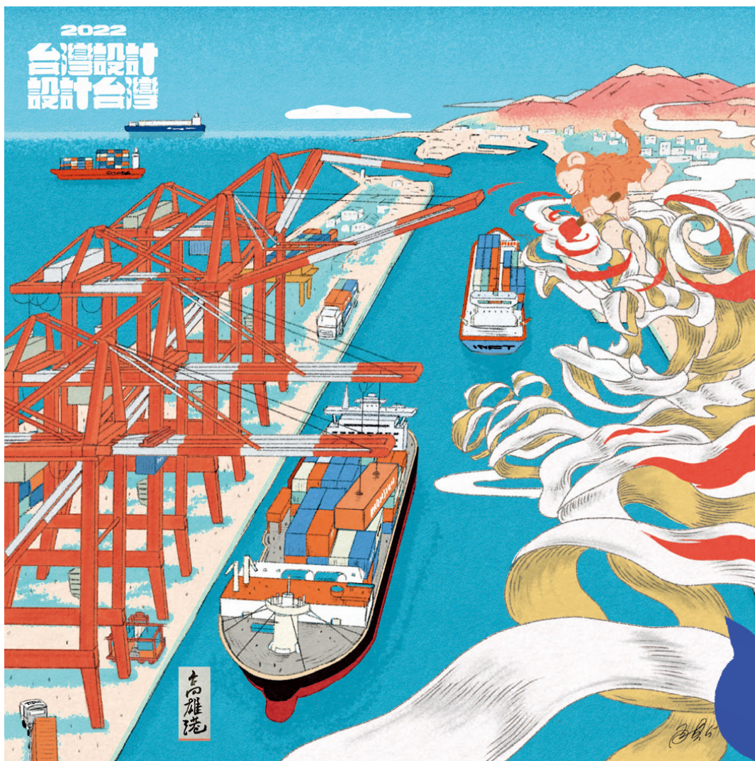
角斯於2022年台灣設計展創作《橋式起重機》作品。

由 迪士尼發行的「怪獸電力公司」，以可愛逗趣的怪獸形象一舉擄獲老少的心，而臺灣充滿神祕氣息的神話與傳說故事，亦是許多孩子的床邊故事，聽著年獸、妖怪、神仙的故事進入夢鄉，豐富童年的想像。