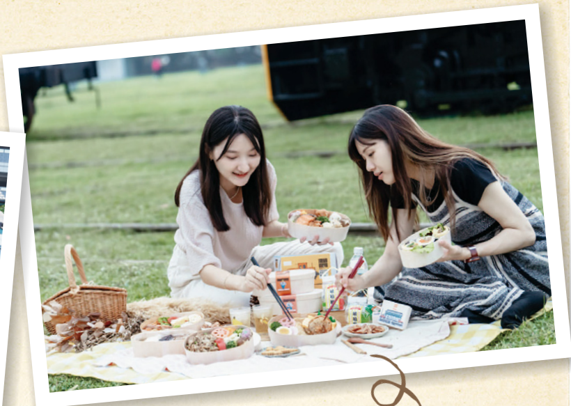
創意鐵道便當限量開賣，一推出就秒殺。

運常見的敞車，再以「枕木」元素設計車內座椅，巧妙重現高雄港站以貨運為主的鐵路運輸風貌。從百年濱線到臨港線，沿途林立著見證歲月的老建築，古色古香的舊打狗驛、北號誌樓、檢修車棚區等歷史遺跡，串織成一條讓人懷想的鐵道人文風景線。