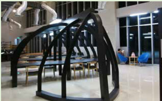
草衙分館工業廠房式外觀與內部空間中裸露的通風口，展現前衛設計風格