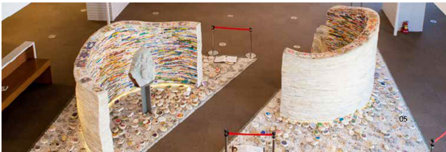
總圖四樓以書砌成的公共藝術作品，象徵東西文化在圖書館匯聚

在圖書館層層疊疊的書架當中，有一座以書砌成的公共藝術作品位藏身在4樓，作品中面向牆壁的達摩和達文西雕像，象徵東西方哲人在圖書館中交流。高雄市立圖書館總館擁有許多特色館藏，如國際繪本、樂齡圖書、多元文化、高雄書等，還有300座玻璃展櫃，展示了不予外借、內容具關鍵或絕版的500多冊經典好書，形塑出人文典雅閱讀氛圍。