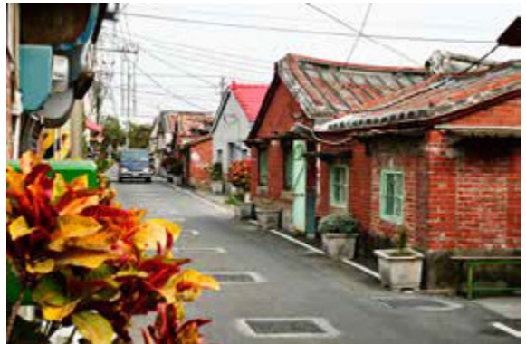
悠閒沉靜的鹽田社區有濃濃懷舊風情

片上，偶爾還可見到打盹的花貓、享受日曬的狗兒，遊客帶著相機就可在社區裡走逛許久，細細感受那份悠閒靜謐與沉靜的歷史氛圍。