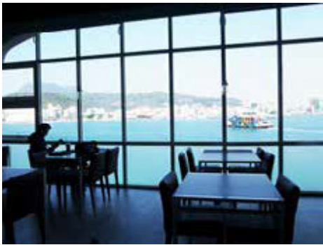
從旗津輪渡站二樓餐廳可望見窗外大港美景