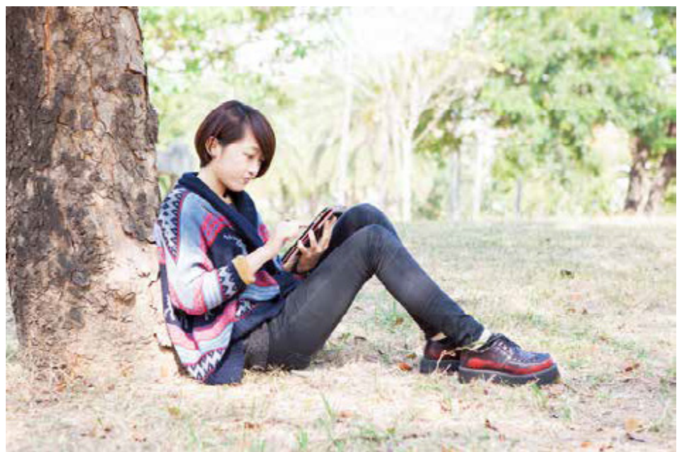
高雄市民上網使用「台灣雲端書庫@高雄」系統，即可輕鬆閱讀