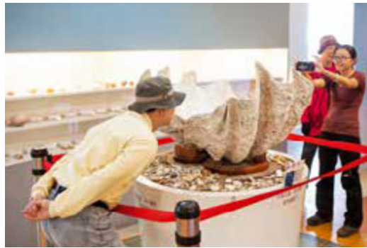
貝殼館裡的巨無霸「二枚貝」吸引民眾拍照

旗津是個海岸崩場地形，海岸侵蝕的情況相當嚴重，造成大量沙灘流失，高雄市政府多年來進行了潛堤工程，2014年完工後成功守護沙灘，並持續進行旗津海岸公園的修復工程，北起旗津海水浴場、南至風車公園，全長約3.6公里，建立3道海岸防線，包括離岸潛堤工程、設置砌石護岸駁坎、補植濱海植物形塑海岸林相等，也改善自行車道景觀，特別是黃金貝殼系列作品更豐富了旗津海岸的樣貌。