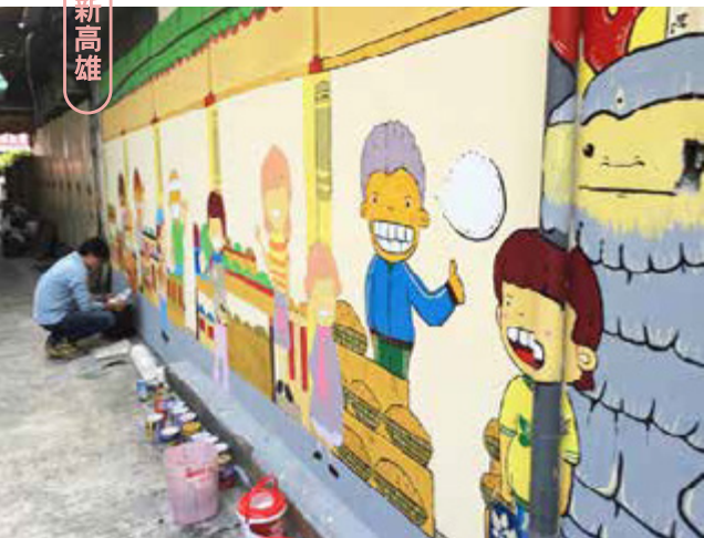
插畫家為後街牆面彩繪