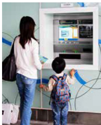
總圖一樓設置自動還書機，民眾還書真方便

書、乙地還書」的便民服務背後，其實有一個圖書館的物流車隊，這支由企業捐贈的物流車隊，除了要讓圖書歸位，還要支援讀者的網路借閱，讀者在家透過網路借書，平均2.5天就可到達指定的圖書館，比知名網路書店寄書還快！