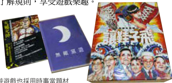
桌遊遊戲也採用時事當題材

一般而言，派對遊戲與反應遊戲有助於炒熱氣氛，經營遊戲、陣營遊戲可以過足推理與思考的癮、大玩心機。近年興起的國產遊戲更結合時事，趣味十足，店家也提供遊戲教學，讓大家迅速了解規則，享受遊戲樂趣。