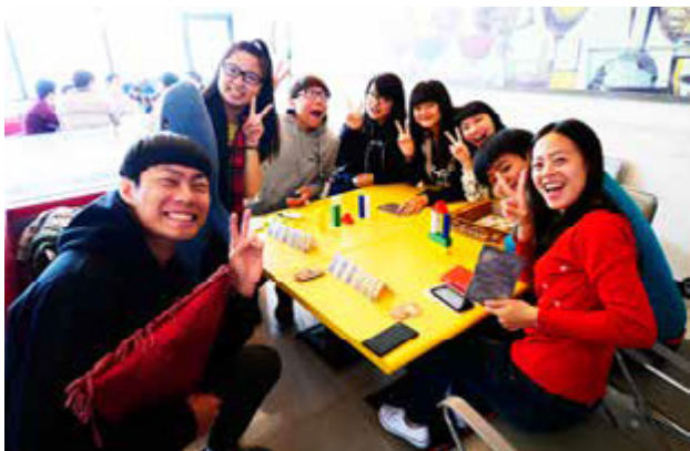
年輕人到桌遊餐廳社交、聚會成為新興風潮

三五好友聚在一起用餐、談天的場域，除了各式美食店家，近年來還增加另一種新選擇—桌遊餐廳，除了增添聚會趣味性，更可聯繫感情、放鬆身心。