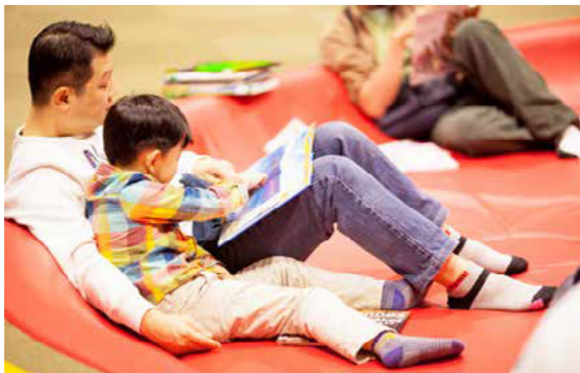
家長可和小朋友在總圖地下室的「國際繪本中心」共度愉快的親子共讀時光