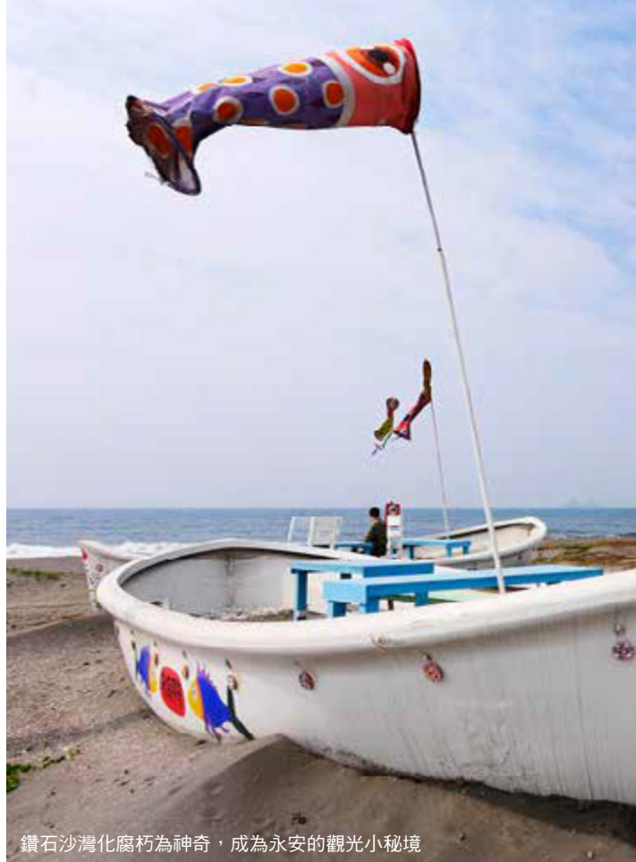
鑽石沙灣化腐朽為神奇，成為永安的觀光小秘境

鹽田社區是日治時期因開闢永安鹽場，招募台南北門有經驗的鹽工到此地晒鹽，後鹽工人數增加，遂漸形成鹽田聚落，是永安的古老聚落之一。若在午後造訪鹽田社區，柔和的陽光灑在紅磚建築上，走進古厝夾道的樸實巷道、拜訪隱身在巷弄中已陪伴社區數十年的可愛「柑仔店」，隨處可見鹽村的歷史風華，在古老窗台或屋頂瓦