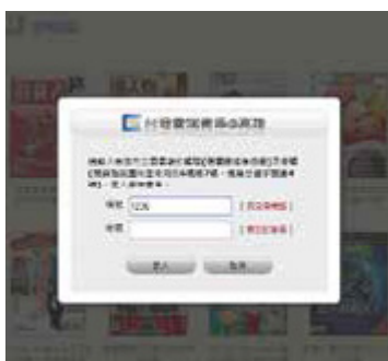
「台灣雲端書庫@高雄」登入與借閱的操作程序十分簡易

「台灣雲端書庫@高雄」從最初建置時不到 2 千冊電子書，到今 (2015) 年市立圖書館總館開幕時，現有電子書及電子雜誌已超過 1 萬冊，包括國內三百多家出版社及獨立出版的書籍，以及目前最夯的關鍵字搜尋：婉君、減肥、美食、輕旅行，都可以找到相對應的圖書、雜誌；未來還會以每年 1 萬冊的數量增加藏書。