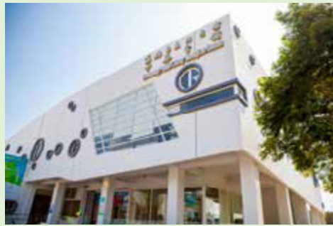
以水資源為主題的中崙分館，空間設計呈現出水的流動性

中崙分館是繼大東藝術圖書館後，位於鳳山區的第4座圖書館，建築設計靈感來自緊鄰的鳳山溪及中崙公園，特以「公園與圖書館的結合」為重點，以「水資源」的概念為設計主軸，館內新書展示區書櫃就設計成水車造型，並且設置有專區陳列水資源相關書籍。館內還有豐富繪本的兒童室、青少年喜愛的電腦檢索專區，同時也針對不同年齡層閱眾貼心規劃不同使用區域，二樓特別設置討論室、多功能研習室，提供學生討論活動使用；長者則可於期刊區休憩閱報，多功能的使用空間，滿足民眾多元需求。圖書館與中崙公園比鄰，書香與綠意融合，文化與休閒相映，成為民眾閱覽、休憩的極佳場域。