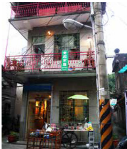
三樓高的「起家厝」成為文創空間