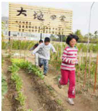
校園空地變身為栽植農作的大地學堂

從此，和平國小的閒置教室成為教育推廣空間，一樓是木工教室、三樓為陶藝與雕塑教室，另在校園東南角空地進行校園菜圃計畫，在這個基地中，以藝術、有機農作種植為介面，帶領民眾一起大手牽小手，創造集體學習新模式。