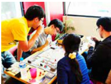
平價經營策略獲得學生族群青睞

鄰近大遠百的 Fun 4 三多店空間溫暖、輕鬆，僅需支付數十元的餐飲低消，不另收取桌遊費用，客滿時限時 4-5 小時，未客滿則不限時，適