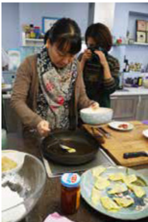
高雄小農生產的食材幻化成誘人的美食

白玉蘿蔔、大寮稻米冠軍以自家優質米製成的黑糖粿、茂林的豔麗紅藜等，高雄 38 區的農特產在小農們的詳細解說下，入了旅客的眼與口，小農們堅持有機的友善信念，也入了旅客的心。