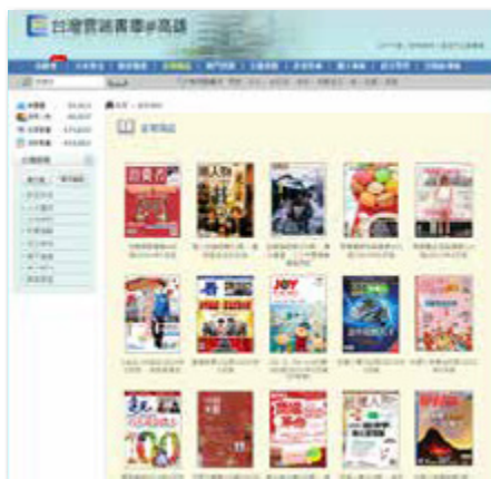
「台灣雲端書庫@高雄」裡，有各種雜誌、書籍提供高雄市民借閱