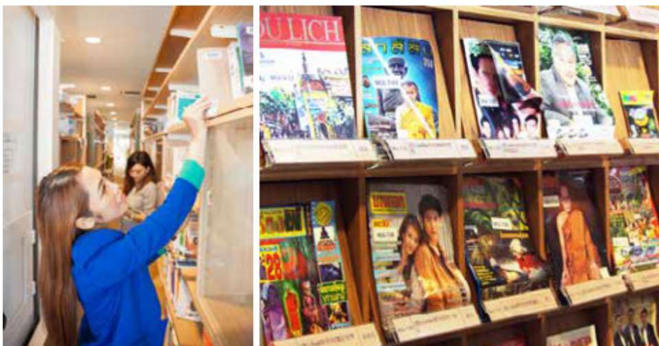
多元文化館藏包含英、日、越、泰等語言書報

位於地下室的「國際繪本中心」也具有多元文化館藏，這裡收藏了來自世界各國的優良繪本，並規劃了臺灣、亞洲及歐美繪本區，在如同樹屋與繪本森林的親子共讀空間中，展現閱讀無國界的氛圍，特別是繪本中心內的借書機台，設計成符合小朋友身高的卡通造型，彷彿是孩子們的大玩偶。