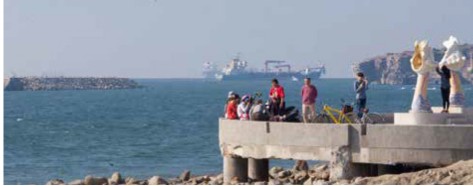
旗津海岸與防風林裡隱藏許多小型的「黃金海珍珠」系列作品