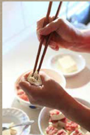
隨手可得的在地食材也可以做出家鄉味

眷村菜口味獨特、蘊含多種配料與豐富食材，我們把眷村菜分為「日常」與「非常」飲食，日常飲食是指眷村家庭裡平日三餐所吃的菜餚，非常飲食則包含過年過節、朋友來訪與坐月子等特殊日子才會享用的。眷村居民利用眷補配給與隨手可得的在地食材，做出一道又一道具有家鄉味的菜餚，憑藉著咀嚼在嘴裡的家鄉味，慰藉心中對親人、對故鄉的思念之情。