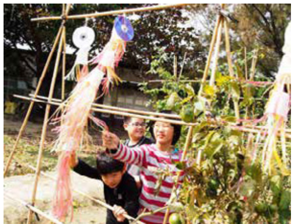
和平國小的小朋友展示大地學堂豐收成果