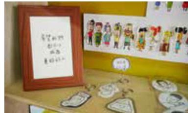
「起家厝」內有許多可愛的文創商品