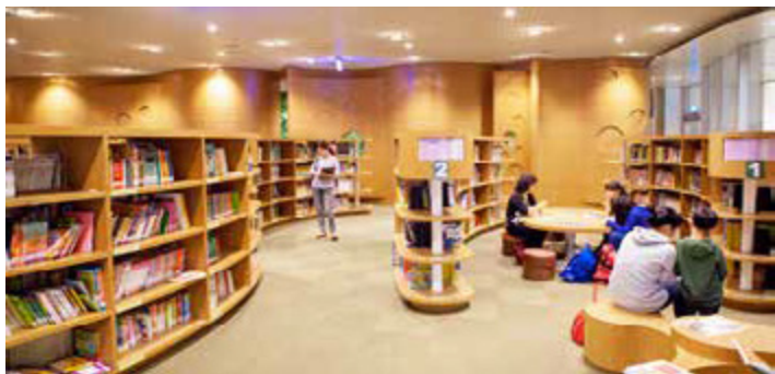
圖書館總館中央的大迴旋梯與地下室繪本區寬敞明亮，提供市民全新的閱讀空間

經過四年的等待，擁有多項創新紀錄的高雄市立新圖書總館在 2014 年 11 月正式亮相，懸吊式結構工法和綠建築結合，營造出穿透性的現代閱讀空間，帶給市民無比的驚喜。2015 年元旦起這座翻轉城市印象的市立圖書館總館正式營運，適逢元旦假期，一、二日累計超過三萬六千人次