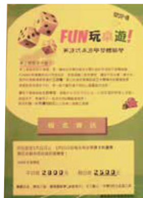
Fun4 常提供機會讓偏鄉學童體驗桌遊樂趣

在因智慧型手機普及而低頭族盛行的現代生活中，桌遊店內卻不常看到低頭玩手機的景象，因為不論是親子同樂或三五好友相聚，都能透過桌遊找回這個時代逐漸失去的——人際之間互動的樂趣與口語溝通的溫暖。