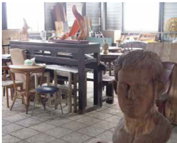
岡山和平國小的閒置教室，成為市民學習與創作的藝術基地