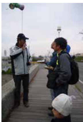
社區志工熱情地為訪客導覽

踏入鑽石沙灣，在沙灘上的花園造景與各色小花，是利用石斑魚運搬船所裝載的淡水澆灌；原本看起來醜陋的消波塊，在以繽紛馬賽克裝飾及局部彩繪後，成為醒目的造型地標、有的還變身成可愛啄木鳥；從海灘挖掘出的