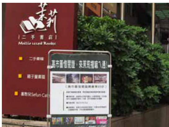
三餘書店、茉莉二手書店