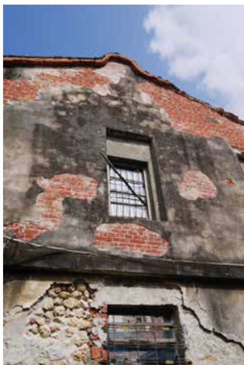
許多高雄青年投入老屋的重建與創新

近年來，地方文史意識崛起，結合文創產業的老屋新生與活化，成為一股流行趨勢，許多青年更成為這股老屋活化風潮的生力軍，不僅引入嶄新思維，讓老屋翻轉新生，也盡心呵護老屋本質，成為不同世代間傳承回憶的場域。