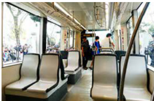
高雄輕軌舒適的內裝