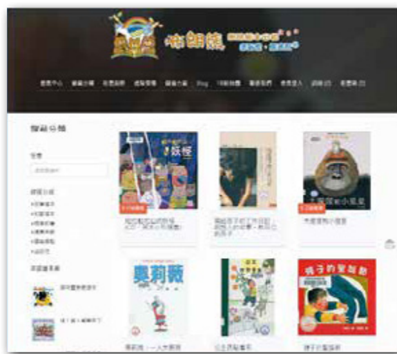
「布朗熊網路繪本出租」提供網路租借和宅配送還書的服務

奇妙的童書世界，歡迎大朋友、小朋友、親子攜手一同來體驗，城市的人文品格一獨立思考、創新能力、美學素養、開拓視野，高雄的種種可能正透過閱讀一點一滴的累積。知識是城市轉型的助力，也是和未來接軌的橋樑，高雄從童書世界看見美麗新境界，以閱讀醞釀、創造城市的更多可能。