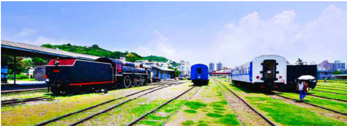
高雄輕軌 C14 哈瑪星站與原台鐵打狗驛站共構

即將在 8 月底試營運的是水岸輕軌中的 C1 籬仔內站到 C4 凱旋中華站。水岸輕軌行經高雄的舊聚落與新興的工商繁華地區，沿線的風貌象徵城市發展的蛻變及臨港線從邊陲到翻轉的歷程，除了 14 個站的站名經由民眾票選出爐，標示出社區記憶和發展的軌跡。部分站體也結合當地景觀做出別出心裁的設計，其中 C3 前鎮之星站鄰近原住民文化公園，採用原住民文化圖騰色彩作為設計基礎；C9 旅運中心站鄰近高雄港埠旅運中心，將設計成具有國際及觀光特色之候車站；C11 真愛碼頭站將結合海洋文化及流行音樂中心設計；C14 哈瑪星站位於原台鐵打狗驛站，將與文化古蹟結合，展現新舊鐵道層次特色，更串連亞洲新灣區的建設亮點，與高雄捷運、公車路網共構出一個永續的綠色交通網絡。