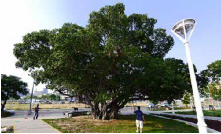
三民區的榕樹公園

除了老樹之外，兩處公園內的文學詩牌也是一大特色，以手工雕刻方式將路寒袖、余光中、曾貴海等在地知名作家的詩詞手寫稿鑄刻於詩牌上，有些詩牌並配合樹設置，例如：老榕樹前是曾貴海《鄉下老家的榕樹》，「你不能動，只好把滿枝綠葉偷偷伸進老家的窗櫺」，對照老榕樹隨風輕搖的枝葉，感受分外深刻；而利玉芳的詩《台灣欒樹》，正好立於公園欒樹下方座椅前，句中描述欒樹於初秋、深秋、冬天的各種色彩，一邊閱讀、一邊抬頭觀賞，詩詞與大樹兩相對應，在綠意環繞的公園中感受文學與大自然融合的自在與樂趣。