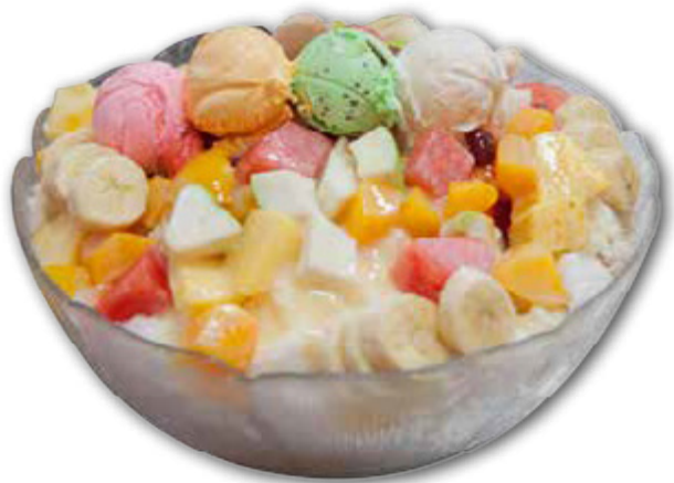
當季新鮮水果搭配剉冰，令人心滿意足

來到鼓山輪渡站前，一整排馬路上數數有近十間的冰品店，其中最引人注目的就是標榜「大碗公」的冰品店。「海之冰」開放式的店面裡外相通，店裡店外的牆壁、柱子甚至是天花板，盡是各地來訪遊客留下的簽名和創意留言，吃了冰可以High到奮不顧身爬上天花板簽名，還沒吃就能感受冰品魅力帶給大家的歡樂氣氛。