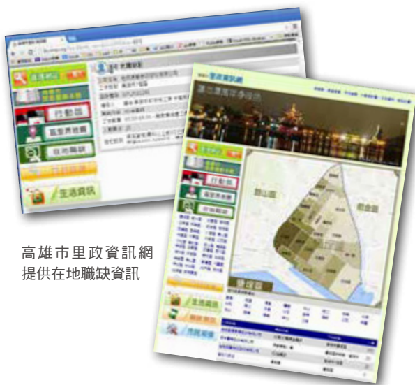
高雄市里政資訊網提供在地職缺資訊

勞工局訓練就業中心接受委託辦理的課程十分具有彈性，因應就業服務中心評估市場需求，開辦包括手做縫紉及編織拼布創作達人、優質農產品加工製作、民宿經營、遊艇銲接、兒童課後照顧班、房屋銷售人員專業等熱門職缺的課程，平均每班招收 30 名學員，幾乎有 3 到 5 倍的報名人數。實用又多元的課程，提供二度就業者適性報名參訓。