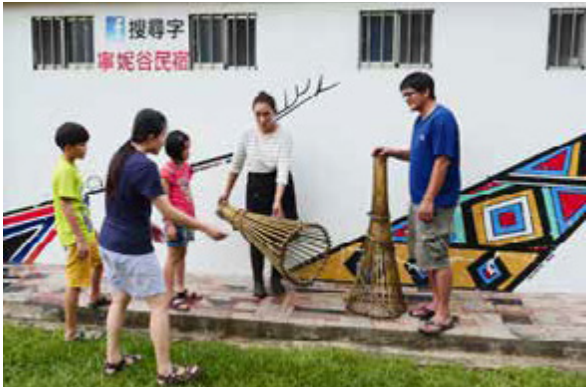
「寧妮谷民宿」有大片草原和兒童圖書館，又可體驗原住民文化，非常適合小朋友