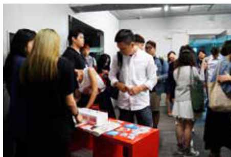
精采多元的《不貧窮藝術節》吸引眾多年輕人參與

文空間經營與青年藝文創業等相關主題，由專家分享如何將藝術化為可經營的夢想與心路歷程，激發青年學子的勇氣，更有動力跨出「做」夢的第一步。