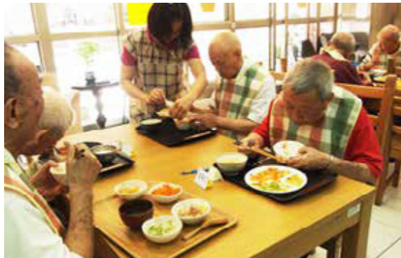
「日間托顧服務」改善高齡者的生活品質也減輕照顧者負擔

甫通過的「長期照顧服務法」，將家屬、照顧者及照顧機構一併納入，讓老有所依的社福拼圖更趨完整。