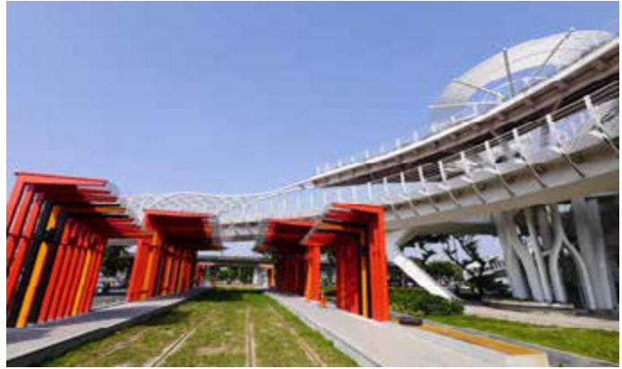
C3 前鎮之星站具有原民風、耀眼明亮

潛盾隧道，乘客感受不到愛河之美，未來輕軌行經跨越愛河的「愛河橋」時，乘客可以依不同時段領略高雄港與愛河的晨昏變化景緻，可說是高雄輕軌的一大亮點，完工後的愛河橋除了輕軌外，還保留各 3 公尺的人行道及自行車道，也會成為高雄城市的新美學。