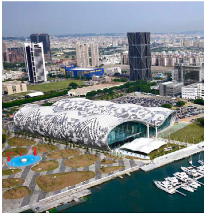
高雄輕軌串聯亞洲新灣區