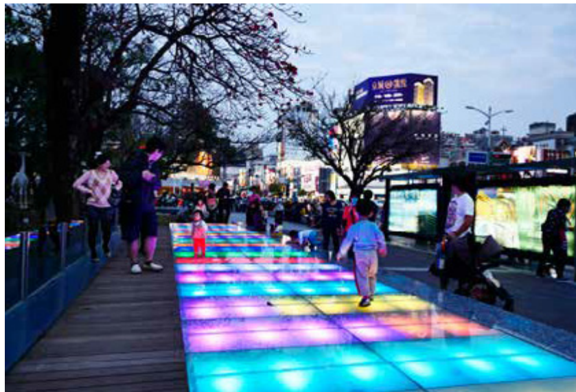
城市光廊繽紛迷離的燈光造景吸引大人小孩駐足

全長約18公尺的城市光廊，每一眼、每一步中，都能感受到藝術創意與驚喜，入口廣場、藝術廊道、3D地景、夜間光影裝置，是結合國內知名藝術家，聯合創作16件主題景觀裝置作品。靠近五福路與中山路的入口處，一位滑著巨大手機的孩童塑像，螢幕上多則訊息通知，彷彿在提醒來到此地的旅人，生活有多久不曾靜心，不曾用心靈去觀看真實世界裡的萬物；馬賽克拼貼的彩色地磚增添步行趣味；高3.6公尺、夜間會發光的不銹鋼長頸鹿，彷彿正昂首吃著樹葉；一道道藝術牆面訴說著高雄的文化與故事；步道上蜿蜒著如同時間長河的曲線。孩童愉悅的踩踏在透出彩色燈光的廊道，旅人的俯仰之間，則是引出奔流思緒的美學創意，透過這座城市亮點，高雄的夜晚如此知性而美麗。