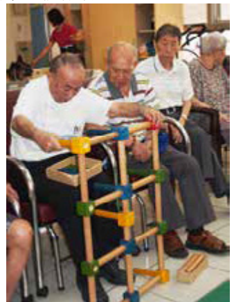
「長期照顧服務法」的通過，讓照顧者與被照顧者都能擁有更好的生活品質

目前光是五十歲以上身心障礙者的「居家服務」一年就有6,000多人申請利用，「居家喘息服務」也有5,000多人，搭配29間居家照顧服務單位，1,300多位照顧服務員、197處社區照顧關懷據點、50個單位提供送餐服務等資源，展現高雄市社區安老與長照服務的多元進展。