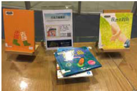
高雄總圖的「國際繪本中心」收藏來自世界各地的優秀童書

高雄是個書香城市，共有 60 多個圖書館和分館，針對親子共讀所發展的童書、繪本主題館逐漸蔚為風氣，目前不論是規模龐大的高雄市立圖書總館「國際繪本中心」，甚至在高雄捷運站都有童書中心，提供大朋友、小朋友進入童話世界，例如：高雄捷運信義國小站的「兒童童話中心」、凹子底站的「童趣樂園」。此外，許多特色小書店和繪本導讀活動，鋪陳出豐沛的閱讀樂趣，還有結合網路便利，提供到宅送、還書的貼心服務，城市中的書香環境、圖書資源逐漸開展，讓閱讀成為生活中的美好經驗！