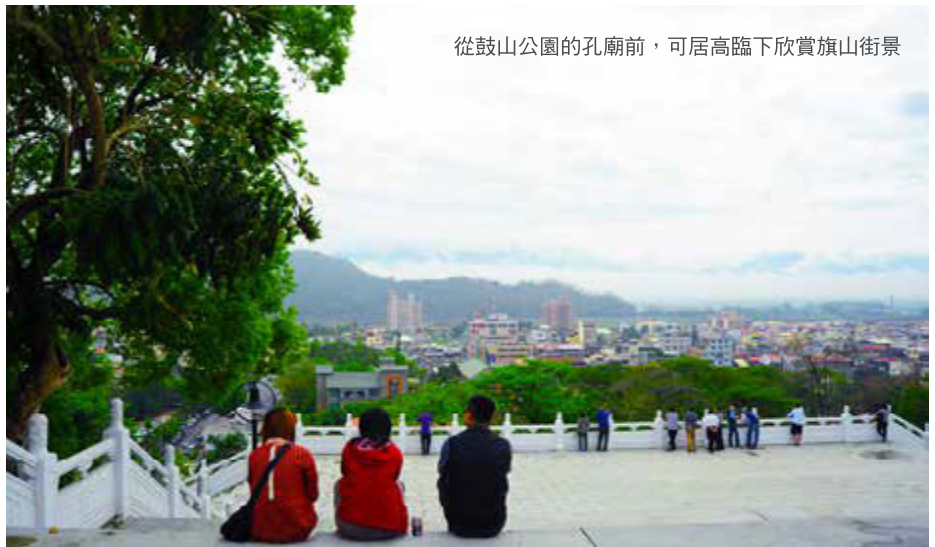
從鼓山公園的孔廟前，可居高臨下欣賞旗山街景

注意一些小細節，可讓野餐更為自在享受，在餐點方面，可準備方便拿取、不易灑露湯汁的輕食，含蓋保鮮盒、有蓋野餐籃皆適合儲放食物，避免戶外昆蟲接觸；也可攜帶防水墊子、椅子及低矮木箱擺設舒適用餐環境；閱讀書籍、桌遊益智遊戲、放風箏，也能为野餐活動增添樂趣。在林木較為密集的野餐地點，選擇方便活動的舒適衣著與便鞋，攜帶防蚊蟲液、防曬用品等；野餐後，記得將垃圾收拾乾淨、帶走，讓綠地永保美麗，為城市與生態環境帶來長遠綠意。