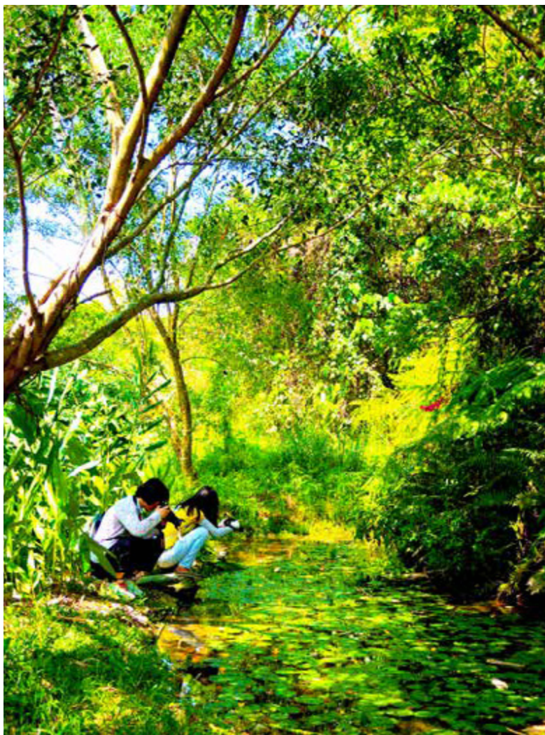
生態豐富的「得恩谷民宿」可體驗露營樂趣、欣賞生態

茂林不僅可露營賞生態，壯麗的自然景觀與豐富的魯凱族文化更值得一遊。源自中央山脈的濁口溪貫穿茂林區區，切割出蛇頭山、龍頭山等詭奇風景，尤其是剛修繕完成的多納高吊橋，凌空橫跨於兩座山頭，長 230 公尺、高 103 公尺，是全東南亞最高的吊橋！還有多納部落的石板屋、萬山部落的岩雕藝術，都是不可錯過的原民文化。