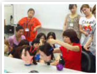
高雄市職訓課程協助學員通過證照檢定以利就業

高雄市擁有港口、農村和重工業的產業基礎，目前積極發展中的數位、創新產業，就業市場十分多元，因此，高市府勞工局訓練就業中心開辦的職種就多達五、六十種，長期自辦美容SPA女子實務、美髮設計師養成班、食品烘培、水電裝修實務、汽機車修護等職訓課程，並協助學員通過證照檢定的比率超過 95% 以上，幾乎是就業保證。自 2013 年以來，結合學界及業界委辦許多職訓課程，例如：和金屬工業研發中心合作的堆高機及 5 公噸以上機上天車操作人員培訓班以及大客車、遊覽車司機的產訓合作，輔導就業率都在 8 成以上。