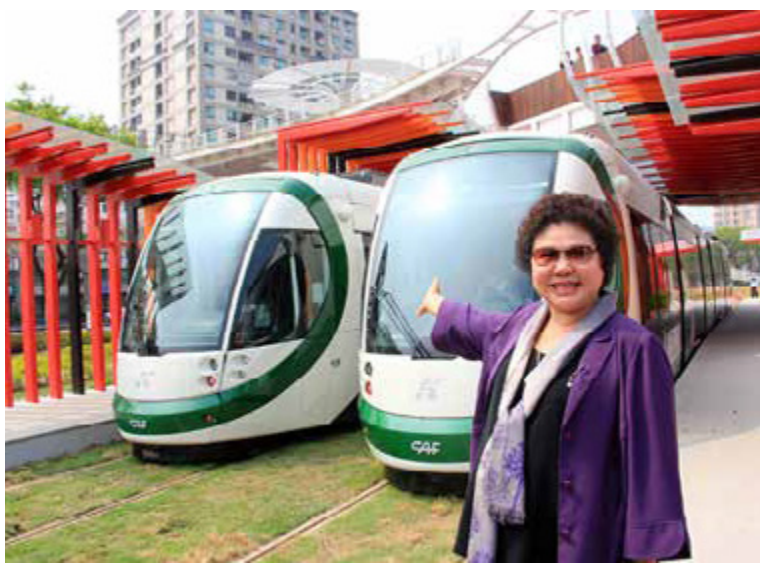
高雄輕軌蓄勢待發

高雄輕軌採用無架空線供電系統，保留了城市美麗的天際線；綠白相間、流線型的車體與簡潔輕量的站體，安靜的融入街景，成為城市裡緩慢移動的風景。