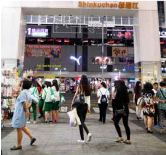
高雄新堀江是流行文化的主要據點