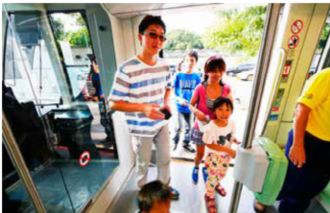
高雄輕軌列車採用低底盤與月台齊平，方便乘客上下車

無論是輕軌月台無驗票匣門的設計，或是行人車輛行經輕軌行駛的路口要遵循號誌指示行進、停止，都需要一段時間適應才能養成習慣。因此，在環狀輕軌第一階段全線通車前，8月開始的試營運，被市府認定為建構城市輕軌文化的重要階段，也是國內輕軌運輸重要的里程碑。