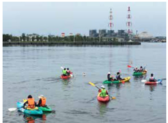
在興達港可體驗多種水上活動

週末時刻，興達港邊的海洋休閒運動專業教室，當熱情飛揚的音樂響起，色彩繽紛的獨木舟、風浪板，以及潔白優雅的小帆船，由膚色健康的青年男女一一抬出，現場民眾就依序報名體驗倘