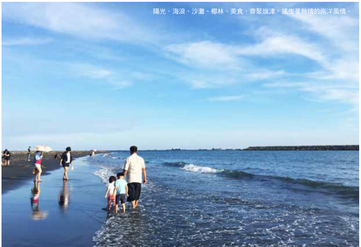
陽光、海浪、沙灘、椰林、美食，齊聚旗津，搖曳著熱情的南洋風情。

享受踏浪、觀景等海岸活動之後，一旁的漁貨市集、旗津老街上海鮮店家，販售新鮮美味的魚貨、海產料理，一路上烤小卷的撲鼻香味也不時襲來，夜幕低垂下的街道人聲鼎沸，燈火明亮，港都豪邁的熱情氛圍，在此展露無遺。夏日南遊，高雄多元的海洋行程，消暑盡興盡在一遊！