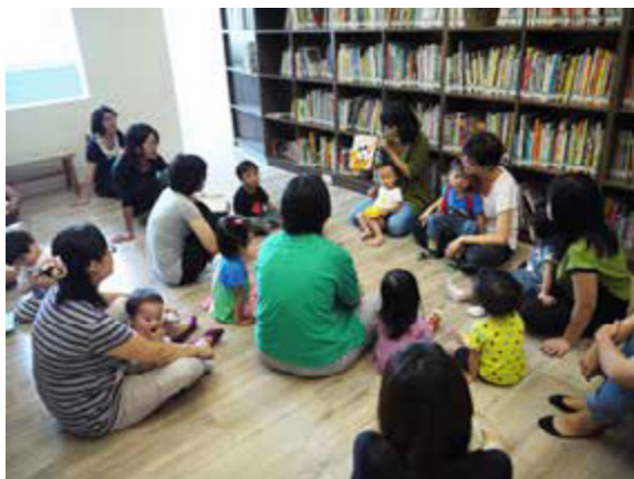
門市結合故事媽媽說故事，讓小朋友沉浸在童書的無限幻想中

茉莉二手書店圖書資源豐富，特別為小讀者規劃閱讀區，不僅環境整潔、分類清楚，明亮燈光與木質地板展現童書區的溫馨氣息，小椅子擺設讓小朋友們能安坐閱讀。許多特色童書店提供親子閱讀的空間與啟發活動，例如：位於左營區的「123 木頭人遊戲書屋」，主要服務對象是 0-6 歲的小朋友，以中英文圖畫書閱讀來引導活動進行，讓小朋友在遊戲中體會閱讀樂趣；「佩續的店」裡，99% 的書都是英文書，並以「兒童文學」及「青少年文學」為主，不僅提供圖書租借，也透過「繪本導讀」、「閱讀營」等活動，和小朋