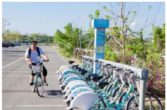
高雄市公共腳踏車租賃站遍佈城市各角落

高雄的自行車道舒適美麗，公共腳踏車租賃系統的費率便宜、站點密度高，自 2009 年啟用至今年 5 月已設置 159 個租賃站、1800 輛腳踏車，在各捷運站、公園、學校、飯店、機關、熱門風景區等處皆設有租賃站，方便遊客騎單車遊逛高雄。公共腳踏車平日租賃量平均 8 千多人次，假日經常破萬人，今年 3 月還突破單月 27 萬租賃人次。為了擴大服務的層面，到今年底租賃站將