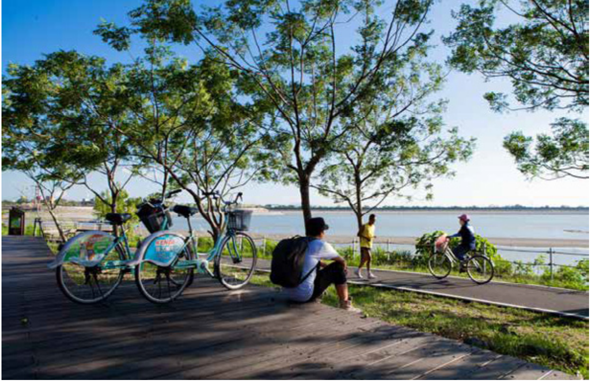
阿公店水庫自行車道舒適、景色宜人

開始呢？從阿公店水庫風景區入口處依逆時鐘方向前行，一路行來的視野非常開闊，而且遠離一般道路，沒有一般自行車道喧囂，沿途經過「日昇蓬萊」與「煙波橋」兩座跨越湖面的吊橋、寺廟精舍、農村聚落、竹林果園等。環繞水庫一周約 1 小時，騎累了，隨時可停下來欣賞水庫的景色，尤其駐足在吊橋上，清風徐徐，整座水庫風光盡收眼底，宛如一幅平湖遠山、水色飄渺的水墨畫作。