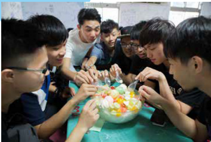
大碗公冰是團體出遊必點的消暑聖品

「哈哈！大家一起吃，就是那種水乳交融的感覺！」剛剛上桌的6人份大碗公冰立刻引起一陣歡呼，光是盛冰容器就有洗臉盆這麼大，紅色、黃色、綠色亮麗的當令水果和晶瑩的碎冰，交互堆疊得像一座小山，淋上香氣濃郁的煉乳，一人一口，是吃水果也是在吃冰。