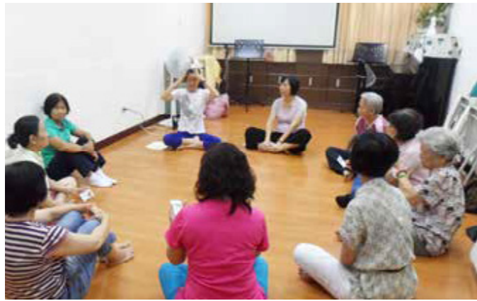
鼓勵長期負擔照顧的人，勇於接受協助

高雄市除了政府資源之外，也結合許多民間業者共同發展、健全長照服務系統。張伯伯是一個居家照顧者，好長一段時間獨立擔負起照顧失智妻子的責任，但妻子總在不對的時間要出門散步、不對的時間要吃飯，使得張伯伯漸感不支直到發出求助訊息，讓高雄市家庭照顧者關懷協會適時導入居家服務協助，生活才有了另一番氣象。