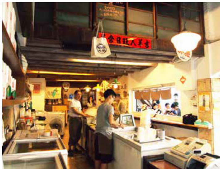
常美冰店藏身於老建築內，不吃冰也有滿滿的懷舊情懷

早年旗山冰品店家眾多，耳熟能詳的「枝仔冰城」創始老店仍在老街上繼續營業，店內眾多冰品除了招牌芋頭冰、舖滿水果的芒果聖代、巧克力聖代外，還有以旗山香蕉製作「香蕉雪糕」，可愛的造型和香氣濃郁的口感，風靡逛老街的遊客。位於文中路上的「常美冰店」，創立於1945年，老闆在20多年前從義大利引進當時少見的冰淇淋機械設備，提供義式冰淇淋、霜淇淋、芋