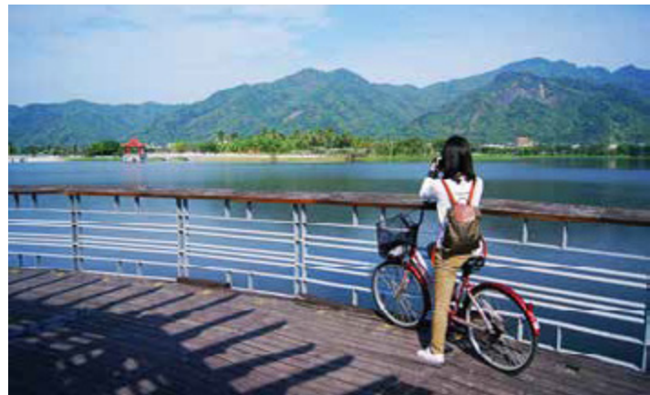
美濃自行車路線可欣賞中正湖的美麗風光

今年初，前鎮區新闢「東臨港線自行車道」，而「阿公店水庫自行車道」也再升級、營造得更漂亮，豐富了遊客騎自行車遊高雄的感受。