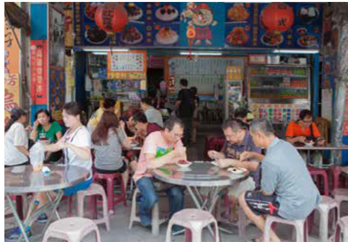
鹽埕區婆婆冰歷史悠久

兩家老店冰品種類繁多，若想要品嚐與眾不同的滋味，特別推薦加入蜜餞的四果冰和八寶冰，蜜餞配料加上水果和粉圓、仙草、杏仁相互搭配，帶給品嚐者不同口味的組合變化與驚奇。現在市面上比較少見的「四果冰」，主要是由木瓜籤、烏梅、蜜餞李和楊桃乾四種蜜餞搭配的冰品，淋上甜蜜蜜糖水，體驗古早味簡單配料卻風味獨具的酸甜滋味。此外，以新鮮水果製成的果汁和冰品也十分受歡迎，像是番茄切盤、盛夏的桑椹牛奶冰都是人氣商品。