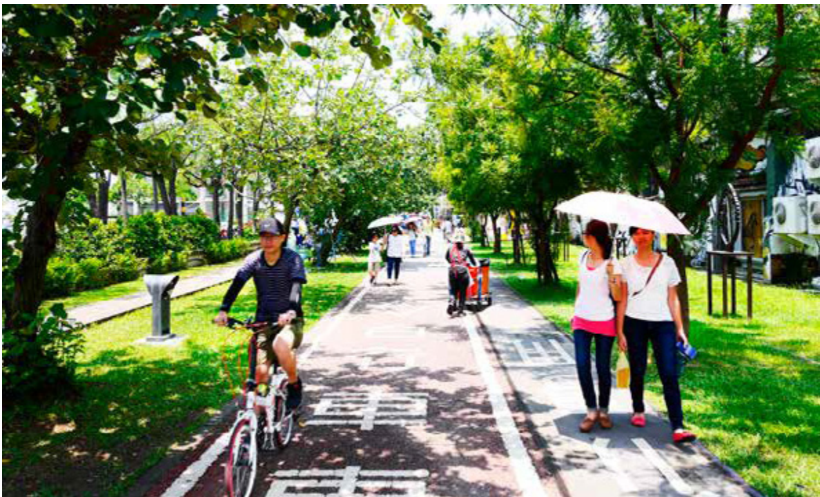
綠意盎然的「西臨港線自行車道」