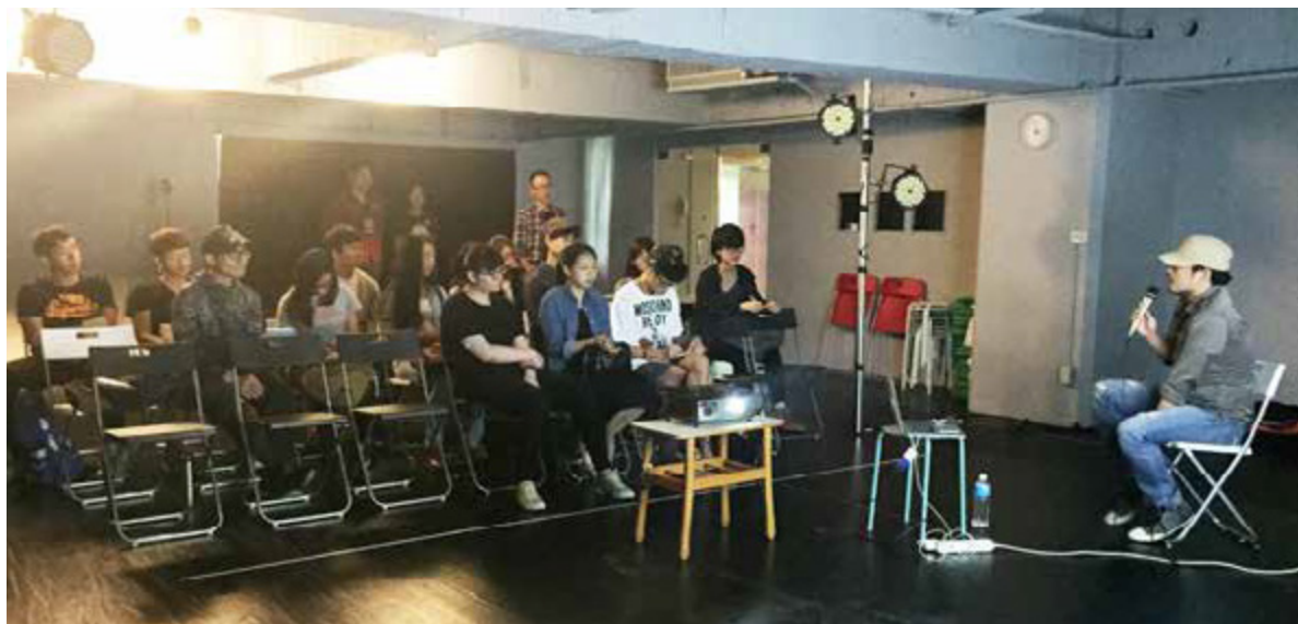
《不貧窮系列課程》提供有志於藝術產業工作的年輕人學習機會