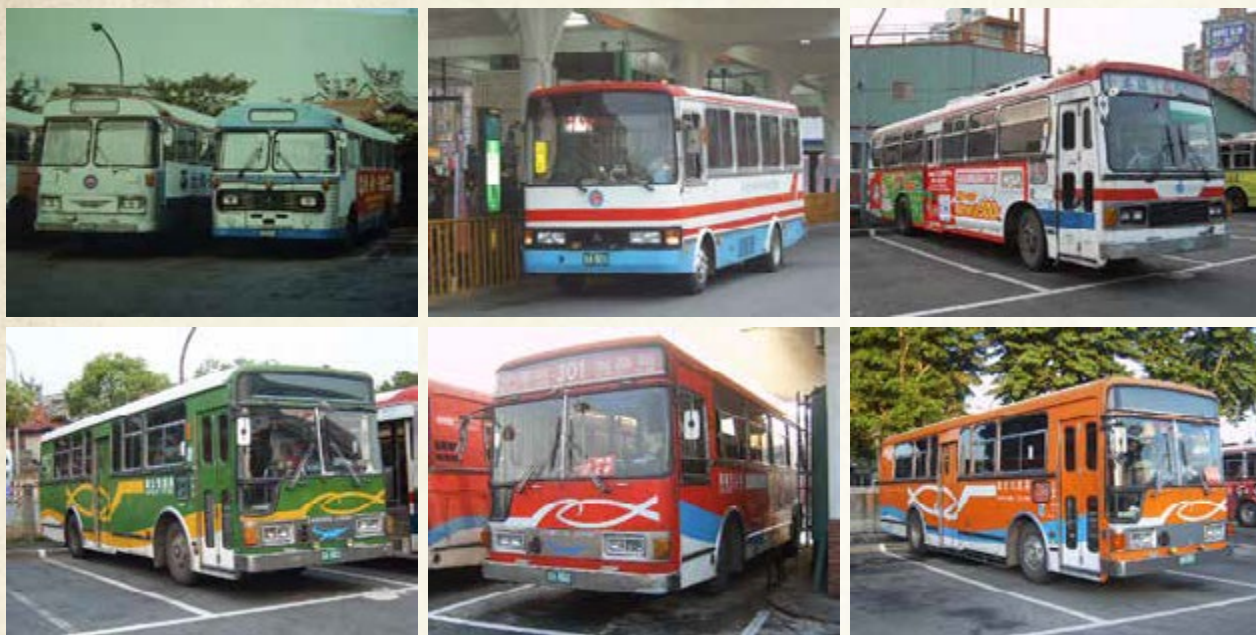
從老照片中看見高雄各式各樣的公車

對許多朋友來說，公車不只是交通工具，更是成長的回憶。隨著時代變遷，公車型態與設備日新月異，就從公車迷的公車文物收藏中，回憶歲月的軌跡或者未曾看見的歷史。