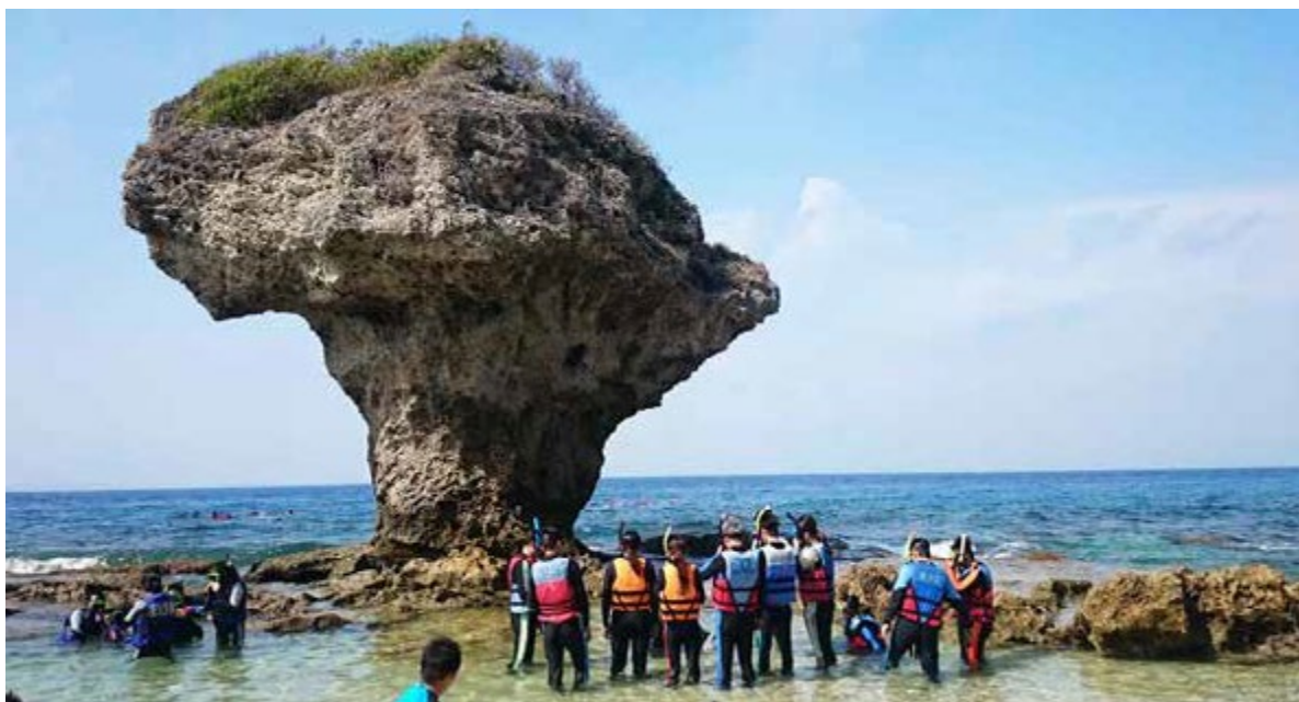
小琉球特殊的珊瑚礁風光，有海上公園之稱

遊艇逐漸駛離鳳鼻頭漁港，也在船尾拖曳出捲捲浪花，環顧四周，盡是藍天碧海、驕陽白浪，不動如山的巨大商船與乘風破浪的漁船小艇，都成為廣闊大海中的深刻風景，讓許多遊客流連甲板，憑欄賞景或興奮拍照。在這份興奮愜意中，