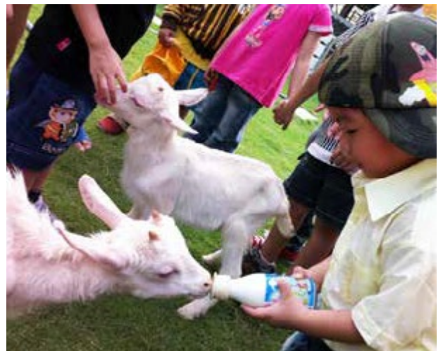
楊珺雅強化農場產品與活動的包裝