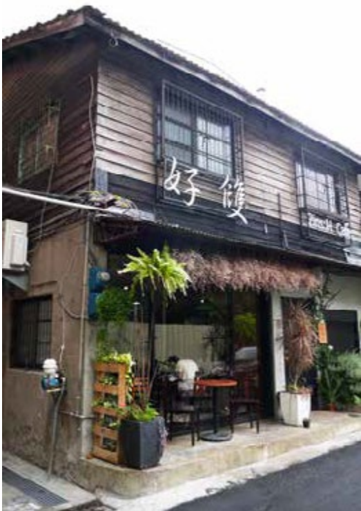
好雙咖啡是一棟兩層樓的日式雨淋板老建築

鄰近愛河畔、距高雄電影圖書館不過數步之遙的「好雙咖啡」，兩層樓日式雨淋板建築佇於小巷中，隱身圍牆後，但仍掩不住其樸雅悠然的獨特氛圍，站在從日治時期存在至今的老屋前，盆栽的綠意妝點得恰到好處，襯托著沉穩灰牆、深褐色木牆、屋頂黑瓦，時空彷彿在窄小巷弄中緩了下來，誘著旅人拉開墨黑寬敞大門，進入更為深刻細緻的世界中。