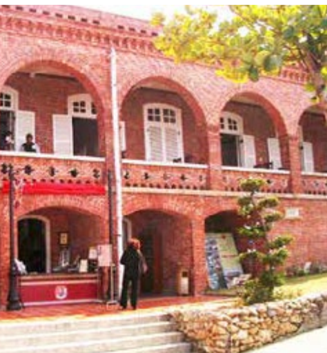
《三維重建港都高雄》團隊將為國定古蹟建立 3D 立體實境模型圖