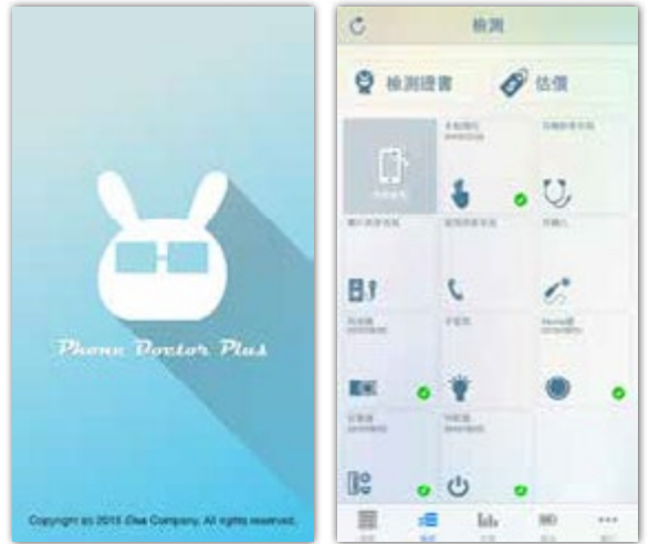
手機醫生 APP 能確認手機功能，預防消費者買到瑕疵品

如果在商店購買智慧型手機，你會如何確認手機功能、防止買到瑕疵品？「手機醫生 Phone Doctor Plus」APP 便在這樣的需求下研發出來，下載者可在 8 分鐘內檢測手機的音效系統、內部零件、無線系統等 27 項功能。2012 年推出後沒多久，便占據台灣 APP Store 總排行榜第一名，「手機醫生 Phone Doctor Plus」2015 年下載率更在 103 個國家進入前 10 名排行榜，在 53 個國家獲得工具類 APP 冠軍。