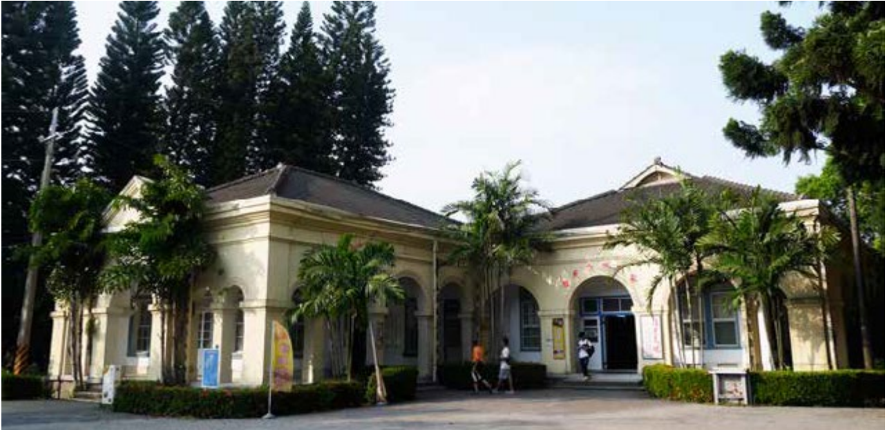
1902 年建造完成的糖廠俱樂部