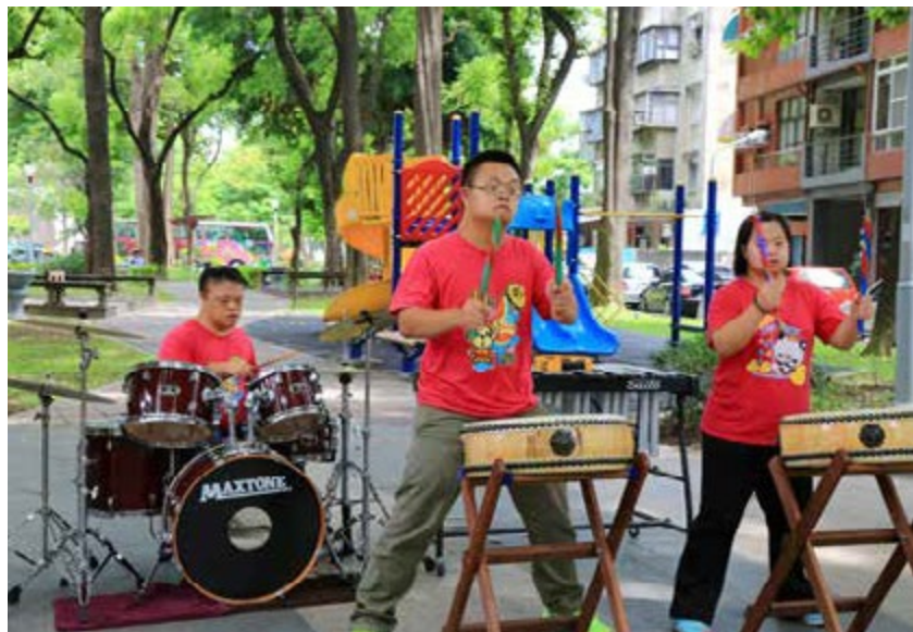
《我是天公仔》團隊化身為音樂公益小天使，傳達正面能量

天公仔團隊的3位唐氏症青年已從學校畢業，但今年將再走入校園，因為心靈能量正向、飽滿的他們，想要讓更多人知道「積極人生觀的生活態度非常重要」。因此，透過圓夢計畫的協助，將化身音樂公益小天使，展開一系列的校園巡迴表演，希望能讓青年學子及家長知道：「生命透過不斷地努力及分享，絕對可以在人生中找到屬於自己的一片天。」