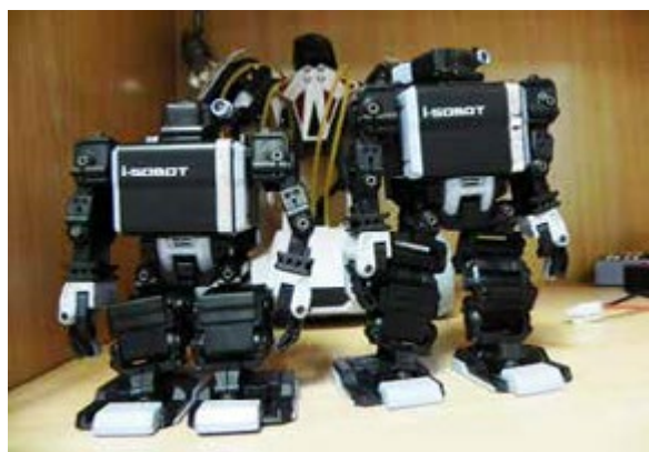
透過機器人教材與互動，學習更有樂趣

為了接軌未來潮流，同時厚植高雄產業研發能量，高雄市勞工局今年 6 月首次舉辦「翻轉吧！青年！You make, You create」創客嘉年華，將高雄在地的科普教育、創客玩家，以及育成創業等潛在能量一一聚集，希望進一步帶動創客（Maker）形成社群，促成更多交流，市府也將為青年提供三創（創意、創新、創業）服務，打造高雄成為創意城市。