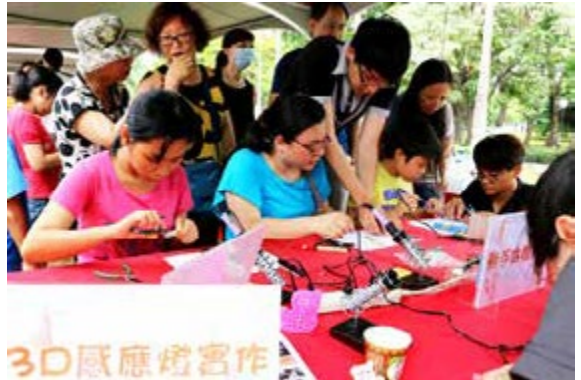
創客在高雄積極發展中

未來，市府將逐步投入建構群眾募資以及產官學整合的服務平台，團結所有創客雄兵，協助創客邁向市場，讓青年根留高雄、幸福圓夢。