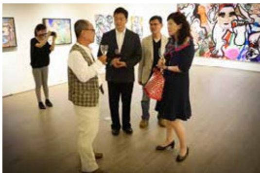
小畫廊推廣以鄉土、生活經驗創作的中生代畫家作品