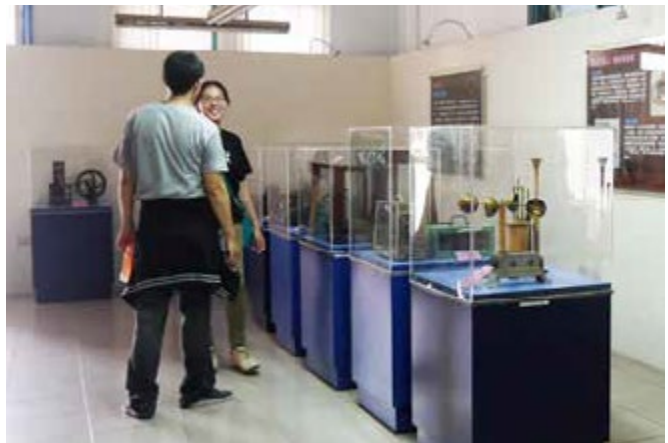
糖廠俱樂部裡展示糖業發展相關文物

從糖業博物館入口到糖節咖啡，處處可感受歷史，連結入口與糖節咖啡的椰林大道是日本人引進種植，用以打造台灣的「南國」風情；大道盡頭黃牆黑瓦的糖節咖啡，則是仿荷蘭在東南亞殖民地的建築，被稱為「熱帶殖民樣式建築」，地上架高以利通風，迴廊和連續拱門造型則來自歐式風格，是日本時期重要建築風格；咖啡廳內擺設有許多當初糖業發展所用設備，如手搖電話、秤重用具等；所提供的飲品以阿拉比卡咖啡豆為基底，這是當時日本人因應南台灣水文而引入種植的咖啡豆。老建築、咖啡香，傳承百年仍在，讓人彷彿穿越糖業時空，細細回味當年。