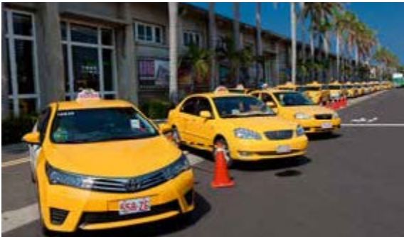
高雄市觀光計程車提供國際旅客優質服務