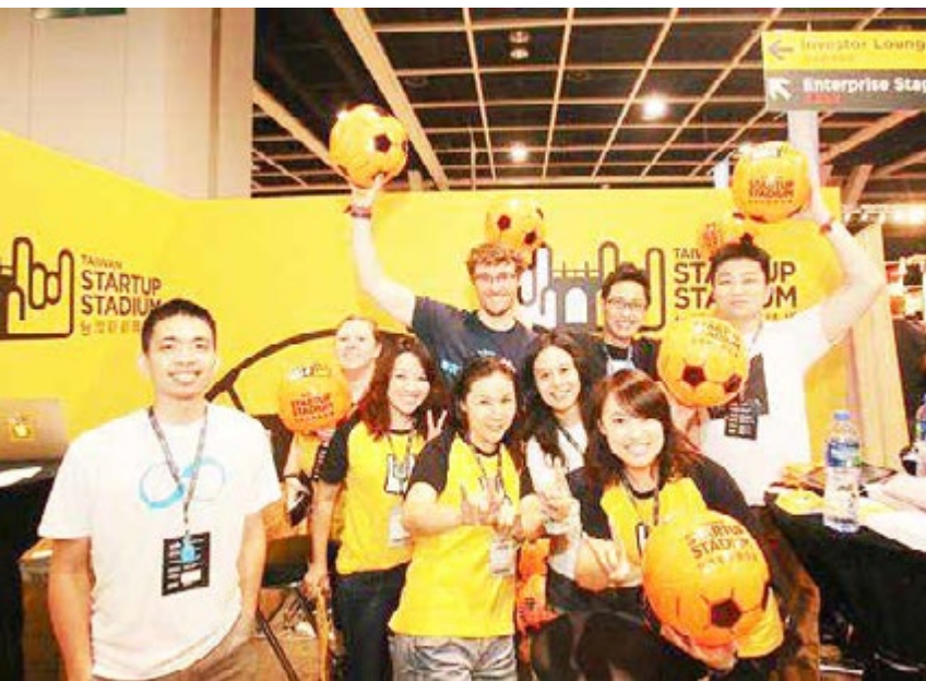
「能對世界產生什麼影響？」是手機醫生團隊的自我期許

iPhone 媒合與交易平台」，讓汰換過快的手機物盡其用，也希望將二手機用於慈善教學，讓弱勢家庭孩童學習撰寫程式。APP 開發之初，團隊曾想像：「能對世界產生什麼影響？」以企圖心和創意、結合在地資源、無國界網路，也能對世界產生好的影響。