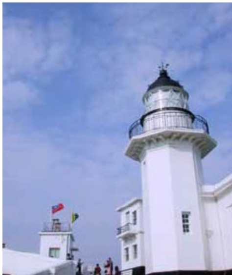
為旗後燈塔拍照、建立立體實境模型圖、紀錄完整建築數據