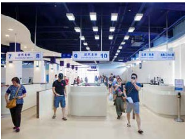
新啟用的國際郵輪中心提升通關效能

在旅運服務的軟體方面，為提供郵輪旅客優質的接駁服務，高市府交通局挑選 10 家優良的