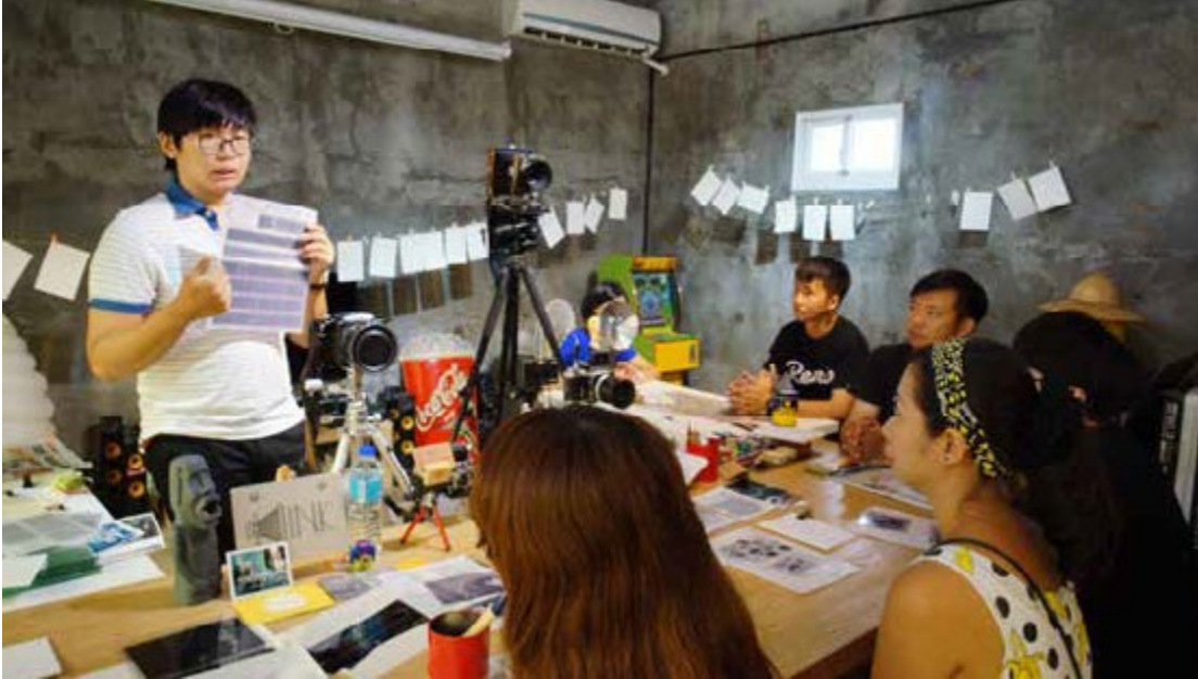
不同專長的職人集合在一起，激發不同的思維及靈感

影器材出租等各式職人夥伴，在這個共同工作空間彼此互助，交織著各式各樣的夢想，攜手邁向創業之路。