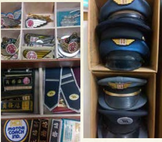
珍貴的公車文物令人回味