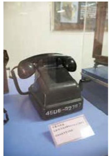
好咖啡、懷舊文物匯聚成時光好滋味