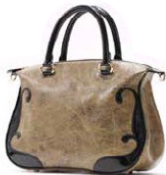
蠶絲牛皮具有溫潤絲光

業歷經開放至中國投資後產業外移、環保意識抬頭後製革業轉型升級等時期，相較於1970年到1990年間全台皮革廠有上百間，目前僅存約十餘家製革廠。「代工不能代一輩子，要把什麼東西留給孩子？」內心的疑問讓他決心創立品牌，考量若產品只以一般牛皮製作，優勢只剩成本，黃甲登遂與團隊投入心血研發出會閃爍溫潤絲光、並通過歐盟REACH皮革檢測的「蠶絲牛皮」。