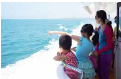
1小時的航程中，遊客愜意欣賞海上風光

小琉球的遊覽車司機開玩笑地這樣形容：「在這裡要環島，1小時可以環3圈。」素有「海上公園」之稱的小琉球，是全台唯一的珊瑚礁島嶼，海水潔淨清澈，地形景觀也極其豐富，美人洞、山豬洞、烏鬼洞、蛤板灣等都是奇岩景點。在海景的陪伴下，以單車遨遊環島，賞落日餘輝，夜觀點點繁星，動人風景讓這個面積6.8平方公里、周長12公里的離島每週末都湧入上萬遊客，東港候船站經常人滿為患，鳳鼻頭－屏東小琉球航線的開航，除了紓解東港船運交通現況，也希望打造北客南送一日生活圈的旅程，讓更多旅客感受南台灣觀光魅力。