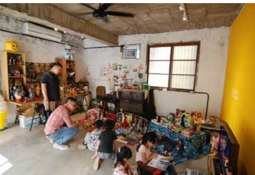
「作伙」集合了具有共同價值觀的工作夥伴

這間老屋在半年前還沒水沒電，如今卻是一群充滿夢想夥伴的創意聚集地。目前「作伙」共同工作空間內，集合了木工、金工、裁縫、傳統攝影、平面設計、室內設計、法式手工甜點、攝