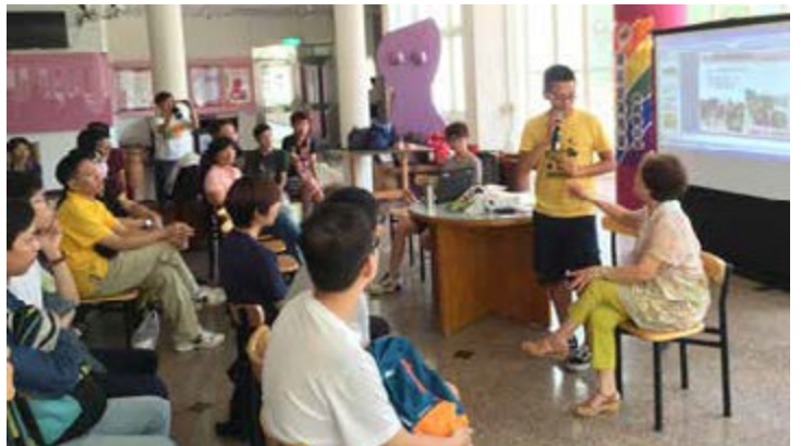
阿克的媽媽分享孩子出櫃後的心路歷程

「在一次國際反恐同活動中，媽媽以同志母親的身份上台講話，我相信這一切都是為我做的！」阿克深深吸一口氣，「感謝媽媽為我撐起大傘，讓我可以傘下努力追求愛情。」