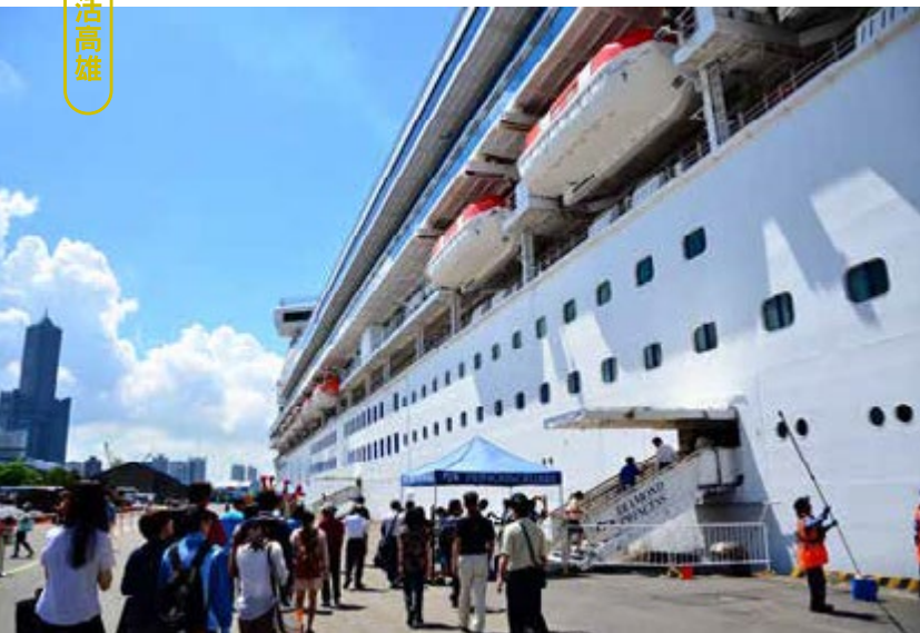
高市府推動「高雄郵輪母港」計畫，停靠高雄港的郵輪數年年成長