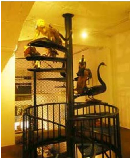
伊日藝術的空間規劃以船舶為設計概念