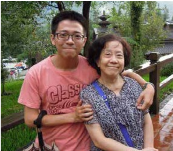
家庭的支持讓阿克可以勇敢愛其所愛