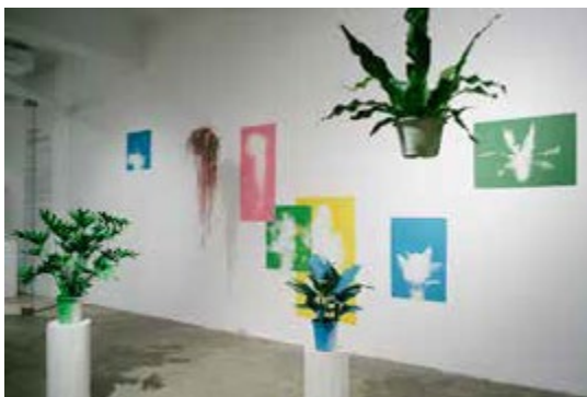
弔詭畫廊的展覽空間具有前衛感