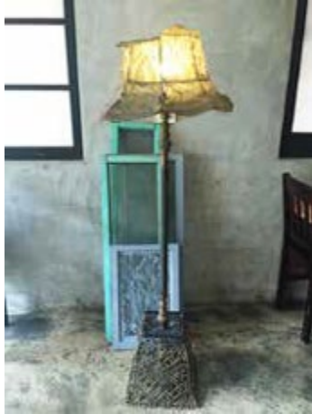
人文氣息濃厚的好雙咖啡

遇一關克服一關的過程中，老屋逐漸變身、展新意，環顧室內外，各個角落宛如日本雜誌中的場景，老窗框、縫紉機等老家具被改製成書櫃、雜誌架等擺飾，讓攝影愛好者停不了相機。坐在水泥牆旁的小圓木桌前，來杯散出暖暖香氣的溫熱咖啡，前方是窗景綠意，一旁是老屋原有的手感木窗，顧客沉浸在這份懷舊靜謐中，或是無聲翻過書頁，或是輕聲細語交談，一同珍惜、感受著有老屋咖啡香陪伴的時光。