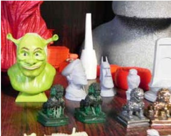
以 3D 列印技術製作的各種公仔

的聲音，甚至每踩一步，鞋子就會開出一朵花。因為有這個想法，所以一聽到學校買進一台或許可以實現想法的 3D 列印機，雖然與自己所學的科系無關，但還是厚著臉皮請老師教導。」洪瑞良訴說與 3D 列印結緣的開始。