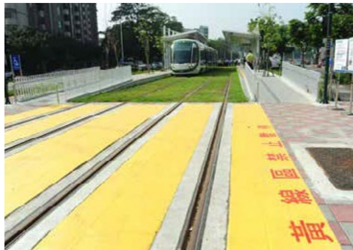
輕軌行經的十字路口「黃色禁止標線」區一律不得停等

隨著臺灣第一條輕軌啟程上路，營運初期仍由義交朋友們協助路口交通路況，引導大家適應新的搭乘規則，希望藉由開放大家試乘的機會，一起來認識輕軌新規則。