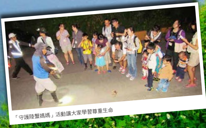
「守護陸蟹媽媽」活動讓大家學習尊重生命