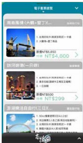
搭配 APP，旅遊行程一指搞定

範圍再擴大到其他縣市，並結合規畫中的英文平台介面，提供境外旅客更便捷、更輕鬆的南台灣旅遊服務。