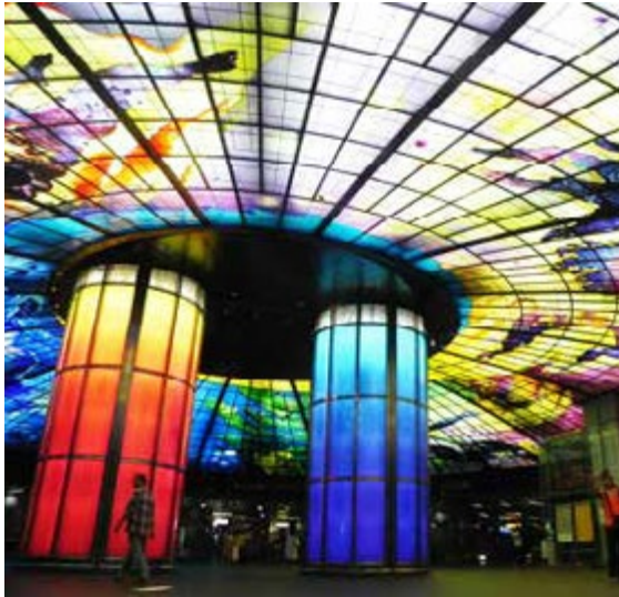
美麗島站的光之穹頂結合聲光音效進階至 2.0 版