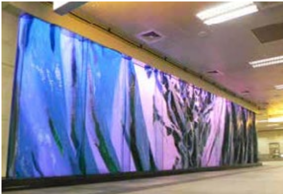
高雄國際機場內的「凝聚的綠寶石」玻璃雕塑作品

美麗島站「光之穹頂」由義大利籍水仙大師所設計，由『水、土、光、火』，象徵宇宙與人的誕生、成長、創造與毀滅，成為許多來到高雄旅客必遊的朝聖地。面積達 667 平方公尺的光之穹頂，由 16 根彩色發光圓柱，以及正中央兩支閃耀的廊柱共同支撐，共有 1252 扇窗，總計 4500 片玻璃鑲嵌而成，不但是世界最大的玻璃鑲嵌藝術作品，也是日本、德國、美國、墨西哥、義大利等團隊的智慧結晶。近期更加入藝術聲光特效，藉由聲光舞動的節拍與視覺效果增添光之穹頂的動態美感。「穹頂光炫秀」每天 11、15 及 20 時各放映一場，週五 19 時加映，週六與週日則 17、19 時再加映，並提供免費借用自動導覽語音服務。