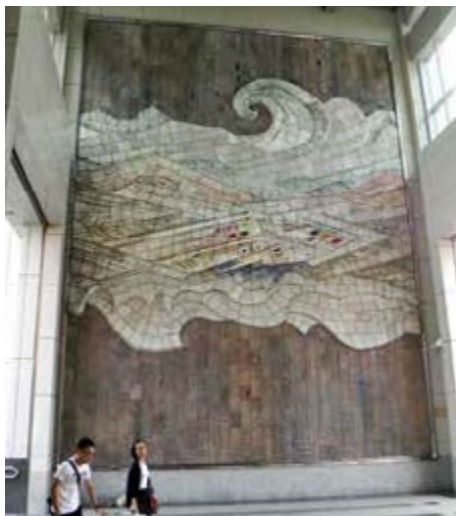
位於橋頭火車站大廳的「天工開物」

沒錯！搭乘捷運就能欣賞國際級的公共藝術品，高捷紅線從小港機場一直延伸到岡山，各個捷運站都設置公共藝術，讓城市成為一座以動力連結的大型美術館，尤其捷運紅線邀請許多優秀藝術家，在許多站體精心打造充滿文藝氣息的大型公共藝術，讓遊客感受人的溫度、城市的浪漫。