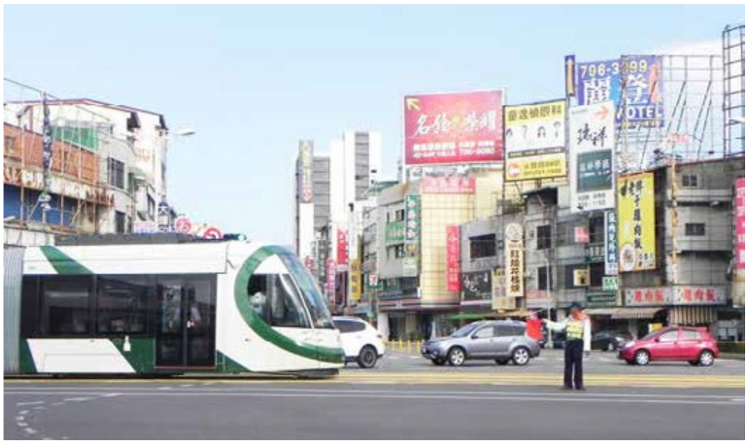
輕軌與平面道路共用路權，請大家注意「禮讓」，確保交通安全

試乘期間，除了提供大家體驗平穩、舒適的輕軌交通運具，更希望大家認識輕軌專用號誌，以及與輕軌共用平面道路的路權，在交通安全的「禮讓」美德中，建構一個共享共榮的綠色運輸環境。