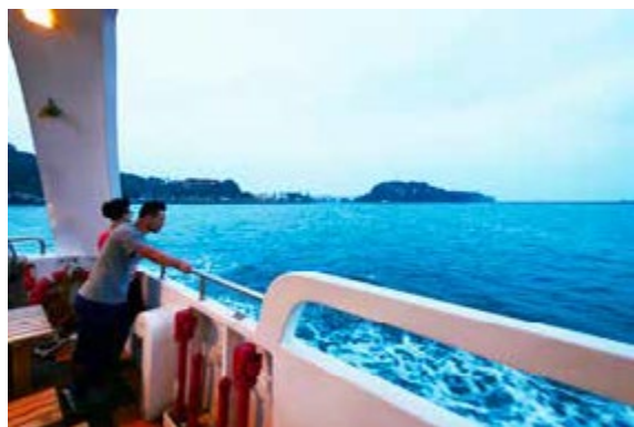
坐遊艇不用當富豪，來高雄搭乘文化遊艇

台灣遊艇製造業享譽世界，但昂貴的遊艇不是人人買得起，搭過遊艇的人少之又少，「高雄港文化遊艇船隊」提供大家輕鬆搭乘遊艇的機會，而且在航行中搭配專人導覽高雄的文化與風光。每艘船皆以玻璃纖維材質打造，雙層船艙內的座椅比照飛機座位般舒適，船尾有寬闊的甲板區，讓遊客可以遠眺海港寬闊豐富的景觀。