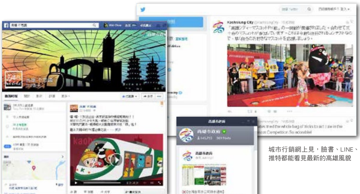
城市行銷網上見，臉書、LINE、推特都能看見最新的高雄風貌

高雄市政府創新思維與行銷，在高雄款（高雄不思議）臉書粉絲團推出一系列圖文，讓大家輕鬆認識在地精采生活，看見日益精進的新高雄！