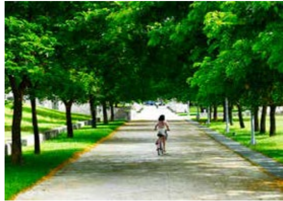
衛武營都會公園腹地遼闊，是出遊散步的好選擇

由荷蘭建築師設計的衛武營藝術中心是南臺灣第一座國家級表演藝術場館，也是自國家兩廳院以來規模最大的文化硬體建設，預計 2016 年底完工。籌備處在整修周邊時，保留了原先軍營房舍和綠地，也打造 281 及 285 棟展演廳、榕園藝術廣場、衛武營戶外園區及都會公園中央草坪等大小空間，每年舉辦百餘場各式演出，夏秋兩季也會以節慶方式舉辦「童樂節」、「玩劇節」。衛武營都會公園遼闊綠地吸引大家前來運動休閒，漫步在公園裡欣賞植物、昆蟲、禽鳥等自然生態景致，感受都市生活與大自然共處的幸福時光。