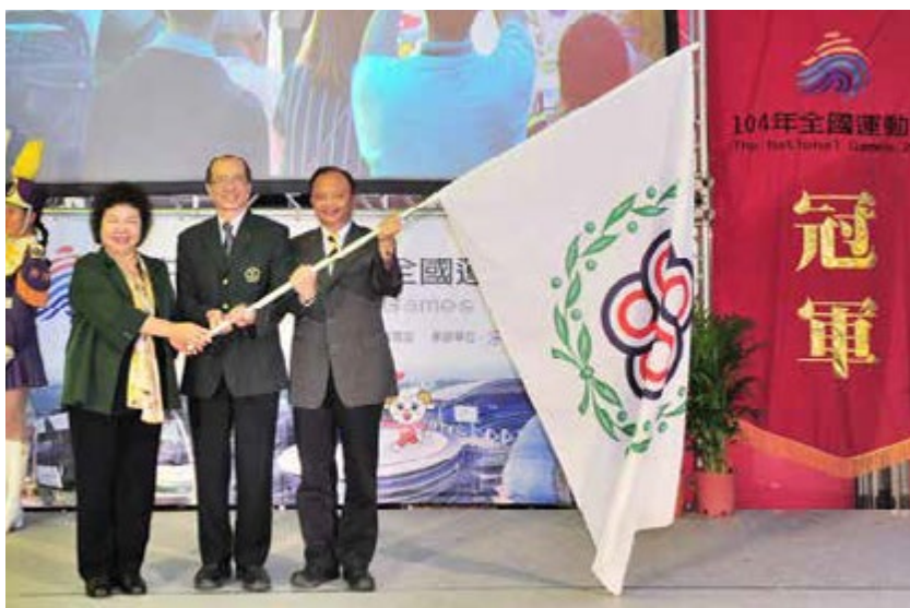
下屆全運會將由宜蘭縣主辦

104年全國運動會10月22日在高雄捷運美麗島站的光之穹頂絢麗的燈光秀下，由陳菊市長將會旗授旗給下屆承辦城市—宜蘭縣後畫下完美句點。