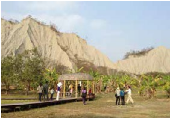
假日觀光公車帶您走走大岡山、月世界

「大岡山假日觀光公車」每逢假日從南岡山捷運站出發，羊肉美食、傳統老街、明媚水庫、磅礴山景、歲月古寺都可一網打盡。在「岡山羊肉商圈」下車，源坐羊肉、明德羊肉等傳統名店都在附近，秋冬吃來最對味；「阿公店水庫站」一旁就有 City Bike 公共自行車租賃站，在整建完善的阿公店水庫自行車道騎乘單車，有涼爽藍天與蕩漾水波相伴；大岡山風景區有百年超峰寺，