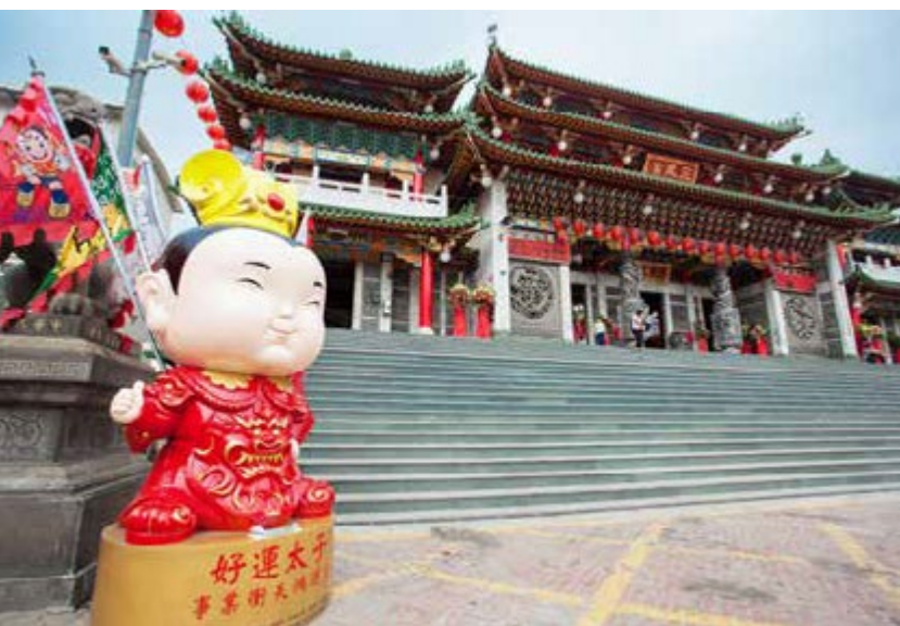
三鳳宮前大型 Q 版三太子

讓我們來一趟尋找福氣三太子之旅！高雄捷運中央公園站一號出口電扶梯口前，露出可愛笑容的大圓臉，圓圓壯壯的身軀穿戴粉紅鎧甲、背著五營旗的大型公仔，這是傳達幸福與愛的「傳