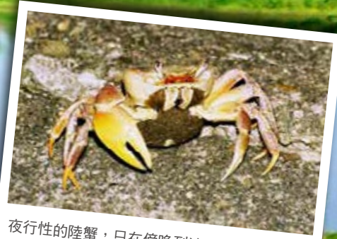
夜行性的陸蟹，只在傍晚到清晨期間才會出現