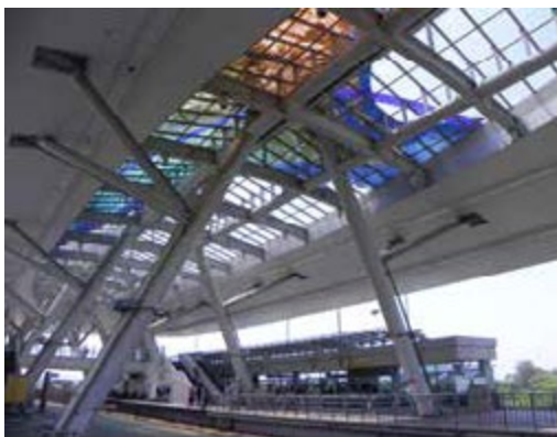
陽光穿透世運站的「空中雨林」，呈現精采的光影變化

捷運橋頭火車站「天工開物」公共藝術作品，由美濃窯朱邦雄博士耗費超過 70 公噸陶土，以 1311 塊陶板組合創作一幅寬 9 公尺、高 12 公尺的陶壁藝術作品。作品中央以幾何圖形象徵城市意象，上下兩端則是孕育蔗糖的土地；載運蔗糖的火車橫越橋頭大地，以開闊壯觀的景致表達藝術家對橋頭謳歌和讚賞。