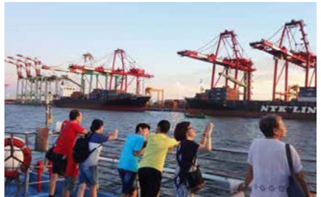
觀光遊輪 · 飽覽海港風情

觀光遊輪大約在夕陽最美的時分啟航，航程沿途可見貨櫃碼頭、旗津燈塔、亞洲新灣區摩天大樓、夢時代的摩天輪…等，由遠至近以各種姿態展現高雄的獨特，遊港、導覽、美食三合一的海上遊程，讓遊客滿足五感體驗，也從另一種角度觀看高雄的城市風貌！