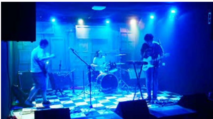
百樂門餐廳是南台灣獨立音樂最佳的發表殿堂

走上二樓，彷彿來到一處奇異空間，三面黑漆的牆面背景襯托出由各種老窗框堆砌而成的舞台，舞台前沒有任何桌椅，客人就在階梯狀的地板席地而坐，省卻多餘的配襯與干擾，讓舞台表演回歸到最單純的感官體驗。三樓則是錄音室，提供音樂團體或其他單位錄音或配音。