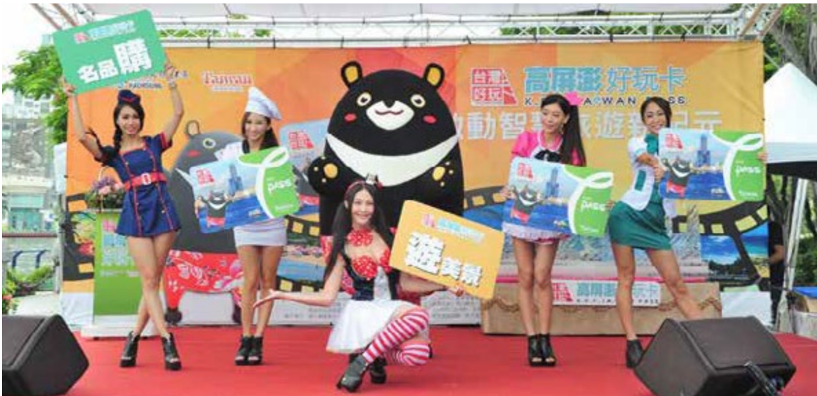
高屏澎好玩卡開啟南部智慧旅遊新紀元