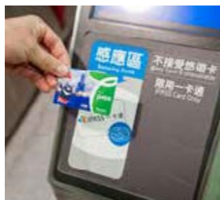
「高屏澎好玩卡」需到捷運站開卡喔

「高屏澎好玩卡」開啟了智慧旅遊新體驗。如何使用「高屏澎好玩卡」呢？遊客可到高捷市集的網路平台 ( http://gojet.krtco.com.tw/ ) 選購行程，再選擇到高捷捷運站拿取或郵寄取得好玩卡；也可以向旅行社臨櫃購買。遊客需特別注意，初次使用好玩卡必須至捷運站請站務人員開通卡片，就可以持卡暢遊旅程囉。