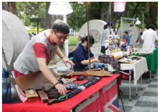
每週末傍晚，文化中心的藝術市集，聚集文創同好一起交流

遊賞高捷紅線的都會風情與大型公共藝術後，繼續走逛高捷橘線的藝文與綠廊新天地。搭乘高雄捷運橘線就能輕鬆抵達駁二藝術特區、高雄市立文化中心、衛武營藝術文化中心、大東藝術文化中心等高雄四大藝文中心。駁二藝術特區隨著眾多的藝文團隊進駐，早已是高雄藝文能量的代言詞。而高雄文化中心則是高雄最早的藝文殿堂，在主建築與正門之間有圓形露天廣場和綠地，其完善的展演設施是許多劇團表演的首選，外圍也有當地藝術工作者創作的市民藝術大道，每週末下午舉行的藝術市集，不僅提供各式各樣街頭藝人展演舞台，也是創意工作者與工藝愛好者尋寶與交流的好去處。