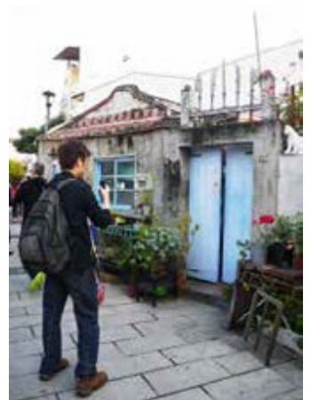
17 號幸福公車串連高雄海線景點至台南安平

黃金海岸、億載金城等景點一一串連而起，從高雄出發，可到興達港停車場搭車，從台南搭車，則在原住民文化會館搭車，興達港觀光漁市另規劃有紅 71 公車，無縫接軌轉乘捷運南岡山站。