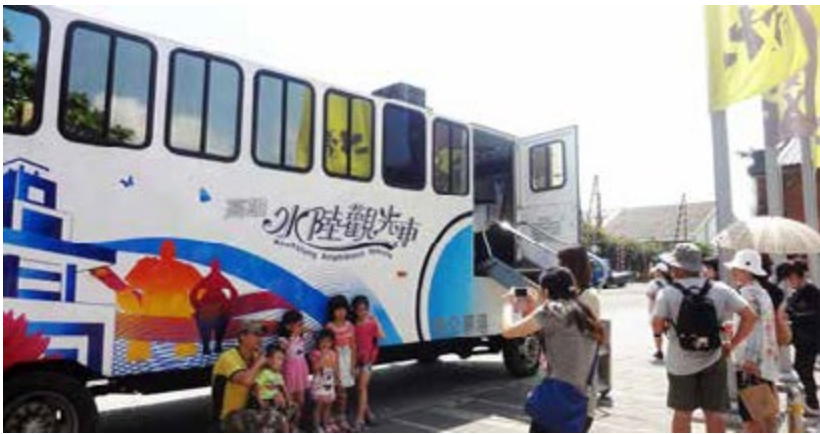
鴨子船、貢多拉，高雄觀光船有多種選擇