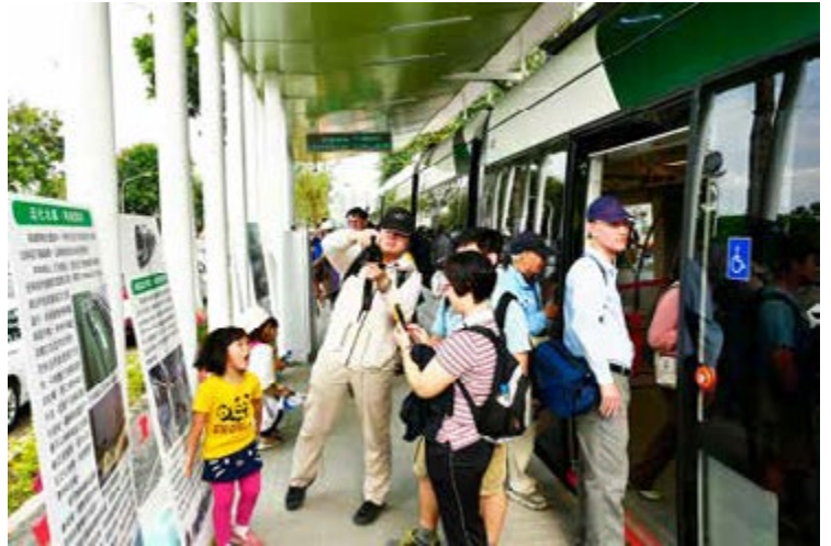
高雄輕軌開放試乘，民眾踴躍預約前往體驗