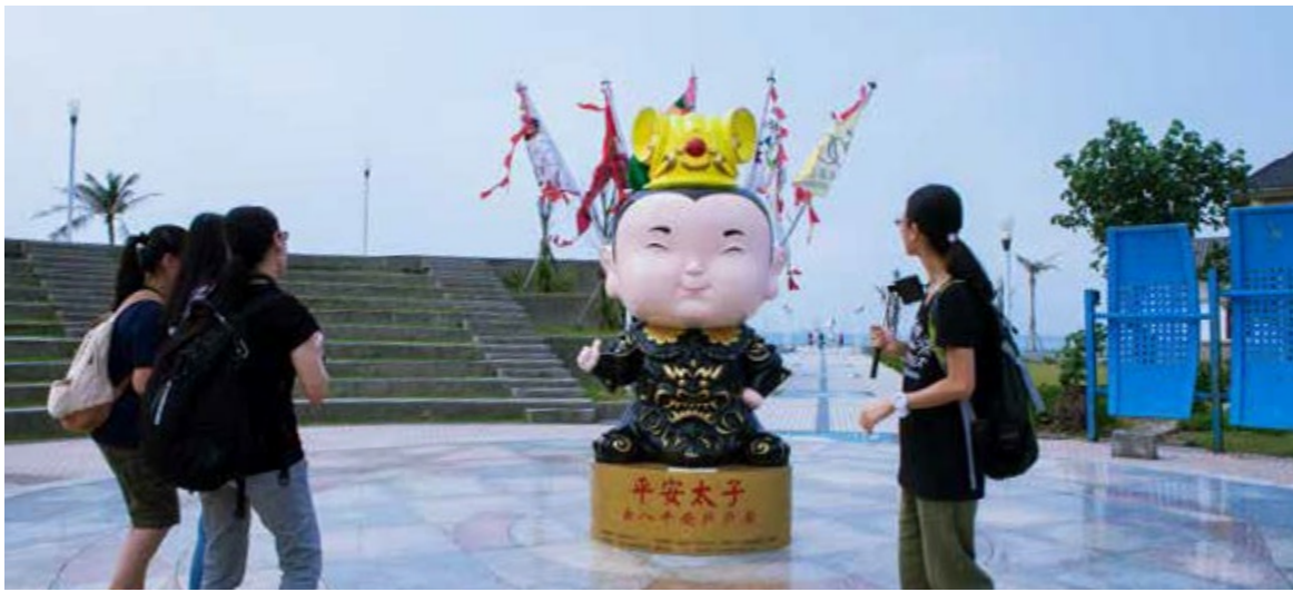
三太子公仔大部分都在市區，利用捷運、公車等大眾交通工具即可抵達

愛太子」。再從中央公園出發沿著中華路來到河西路的三鳳宮，這是高雄著名的「太子爺廟」，黃色「財運太子」象徵財運亨通滾滾來，紅色「好運太子」代表「事業衝天鴻運當」，好運太子原本駐守在夢時代，目前因為慶祝三太子誕辰廟會活動，特別「調職」回來站崗呢！