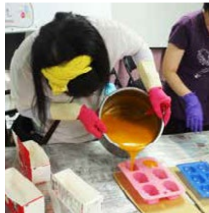
新移民們熬煮鳳梨做出令人驚艷的手工皂