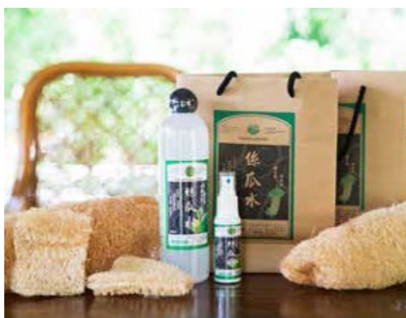
經過長時間萃取的絲瓜露，可應用在各種保養品的基底